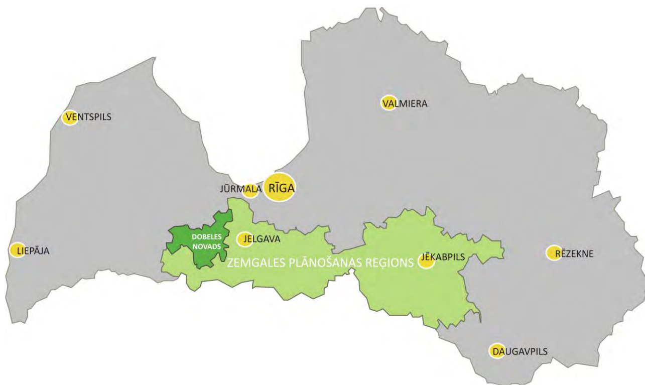
1.attēls. Dobeles novada novietojums Latvijā

Dobeles novads izveidots 2009.gada 1.jūlijā, apvienojoties Dobeles pilsētai un 10 pagastiem: Annenieku, Auru, Bērzes, Bikstu, Dobeles, Jaunbērzes, Naudītes, Krimūnu, Penkules un Zebrenes pagastam. Novada kopējā platība 889,7 km 2 . Pēc administratīvā iedalījuma tas atrodas Zemgales plānošanas reģionā. Dobeles novada administratīvais centrs ir Dobeles pilsēta, kas atrodas 78 km uz dienvidrietumiem no Rīgas un 28 km līdz Jelgavai. Dobeles novads robežojas ar Auces, Brocēnu, Jaunpils, Jelgavas, Tērvetes un Tukuma novadu.