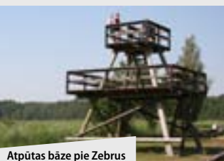
Atpūtas bāze pie Zebrus