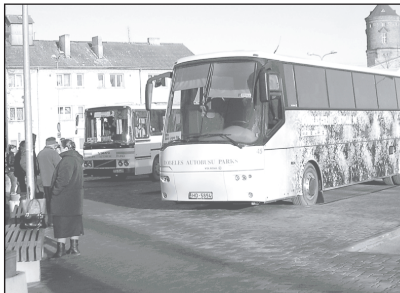
Skolēniem turpmāk autobusā - e talons.

Vēlos pateikt paldies Dobeles autobusu parka darbiniekiem par paveikto aizvadītajā gadā un viņu ģimenēm par atbalstu. Īpašs paldies mūsu pasažieriem par uzticību, un uz tikšanos Dobeles autobusa parka reisos arī šogad.