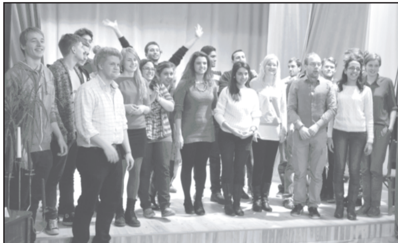
Projekta «The Family» dalībnieki.

No 14. līdz 23. novembrim Dobelē notika jauniešu apmaiņa «JIIC «Saspraude»» un Dobeles Jaunatnes iniciatīvu un veselības centra (DJIVC) projekta «The Family» ietvaros.