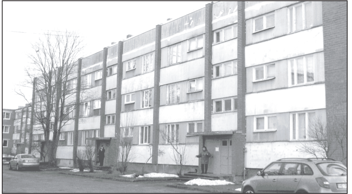
Māja, kurā darbojas viedais skaitītājs.