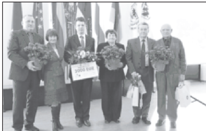
Dobelnieki - konkursa uzvarētāji.

Konkursā piedalījās visu Latvijas un Lietuvas projektu partneru pašvaldību skaistāko un sakoptāko sētu īpašnieki, tika vērtēti arī sabiedrisko ēku labiekārtojumi. No Latvijas puses piedalījās Jēkabpils, Jaunjelgavas, Pļaviņu un Dobeles pilsētas objekti. Lietuvas pusi pārstāvēja Akmenes, Rokišku, Biržu un Birštonas objekti.