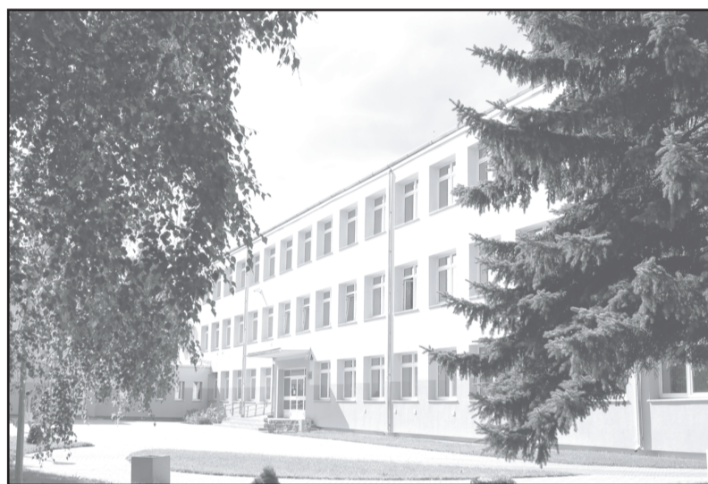
Audzēkņus gaida arī Dobeles Amatniecības un vispārīgizglītojošā vidusskola.

Grozījumu projekts paredz, ka tiek mainīti dažādi koeficienti mērķdotācijas aprēķinu metodikā, taču mūsu novada izglītības iestādēs tas situāciju nevis uzlabos, bet pasliktinās. No piešķirtās mērķdotācijas