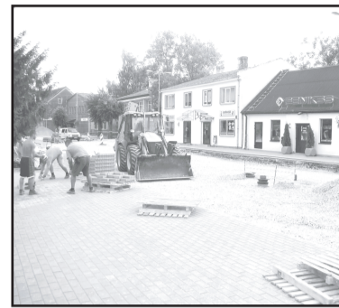
Remontdarbi Zaļajā ielā.

Būvdarbus saskaņā ar SIA «Projekts 3» izstrādāto tehnisko projektu veic SIA «Ceļinieki 01». Būvuzraudzību objektā nodrošina SIA «Jurēvičs un partneri».