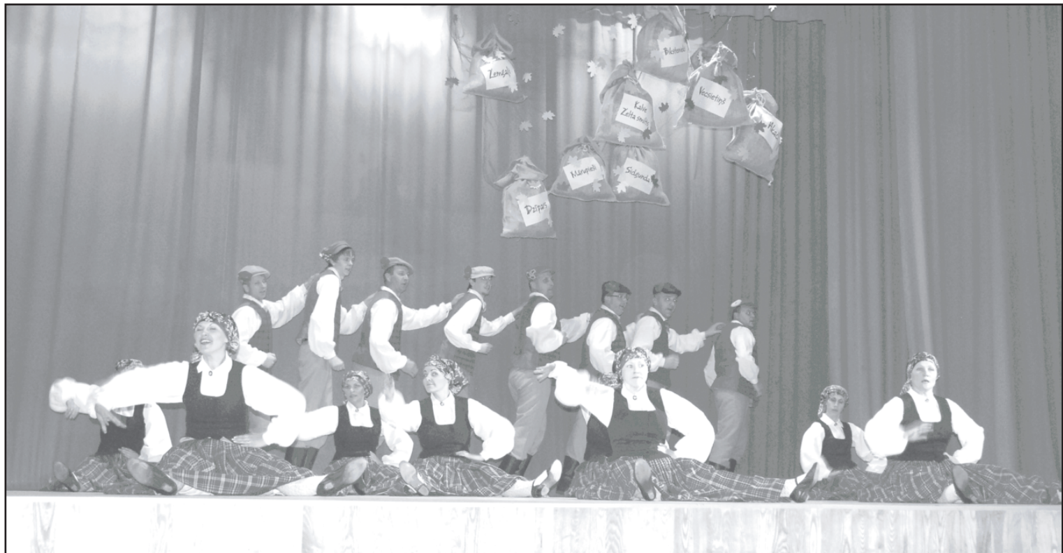
Skats no pagājušā gada «Dobeles ābolu maisa».

28. novembrī 18.00 sporta hallē Latvijas čempionāta virslīgas spēle handbolā sievietēm Dobeles Sporta skola/REIR - LSPA. L.Veinberga, 29156118.