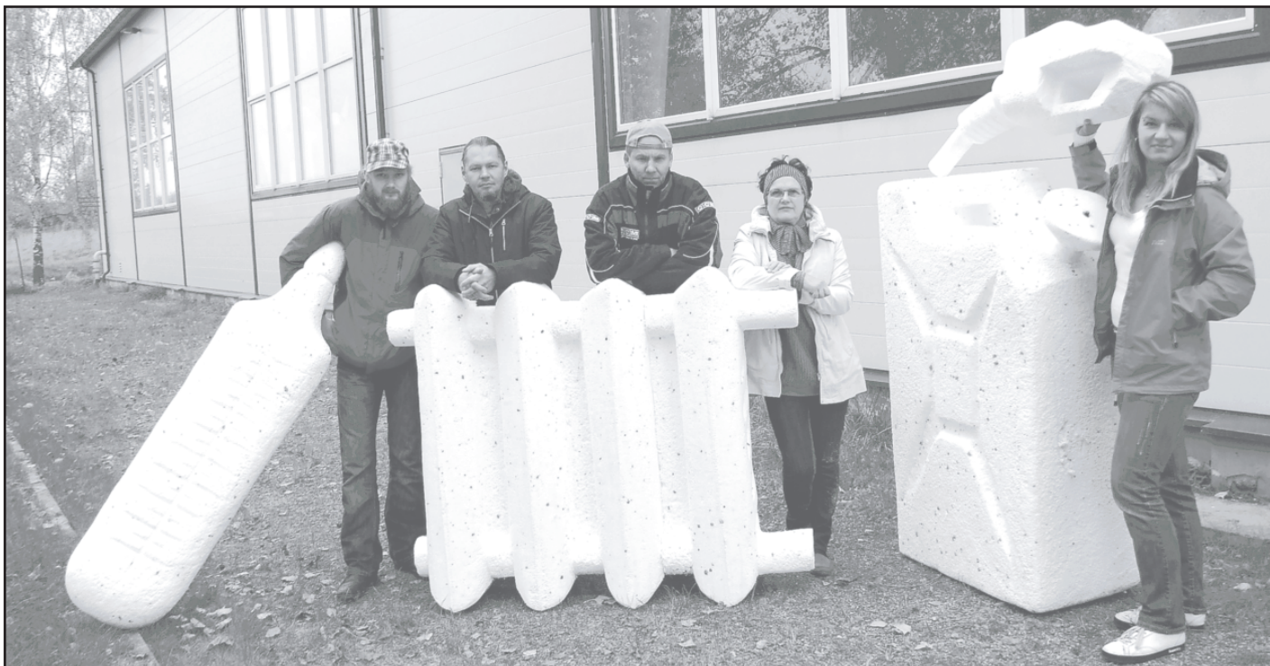
Komanda, kas darina šīgada sniegavīrus.

Dobeles pilsētas kultūras nama kultūras darba menedžeris