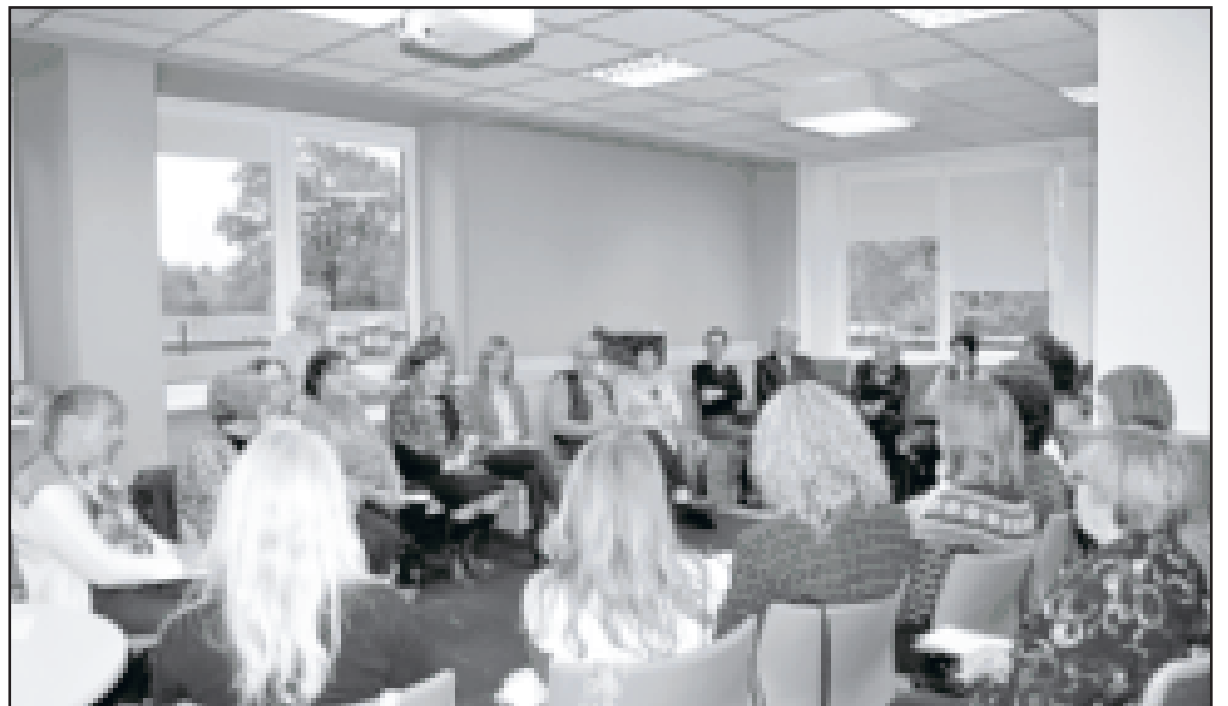
Mājražotāju nodarbībā interesentu netrūkst.

Dobeles Pieaugušo izglītības un uzņēmējdarbības atbalsta centra uzņēmējdarbības konsultante