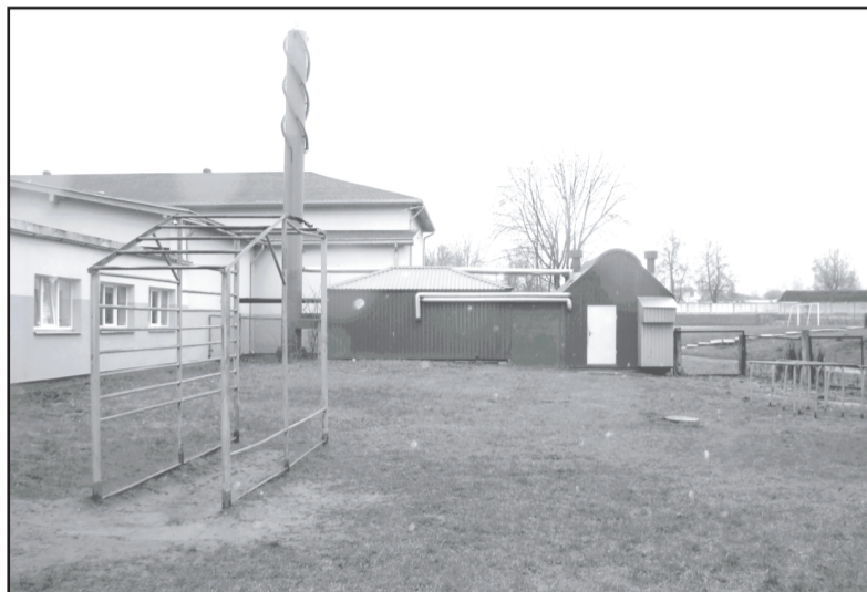
Vieta, kur tiks izveidota «zaļā» klase.