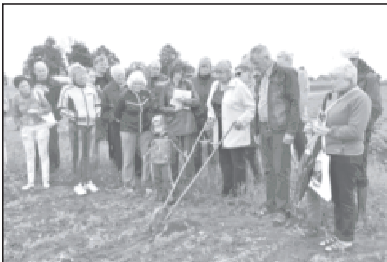
Tā cīnās ar nezālēm bioloģiskajā saimniecībā.