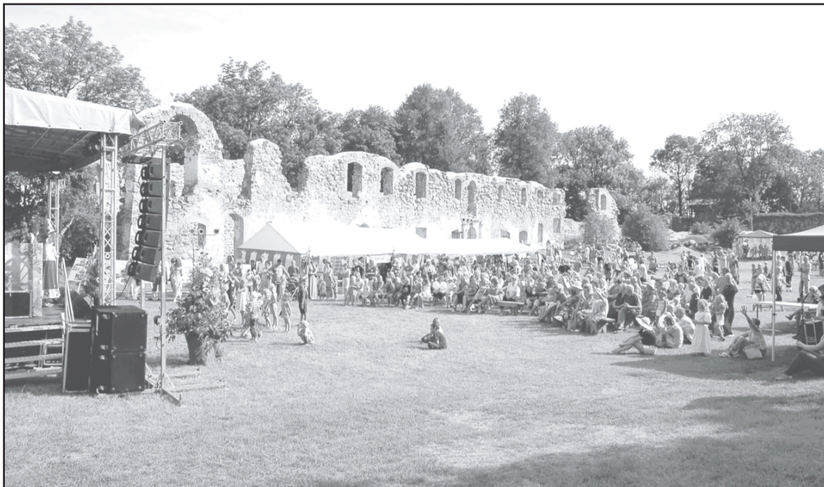
Senās pils svētki Dobeles pilsdrupās.