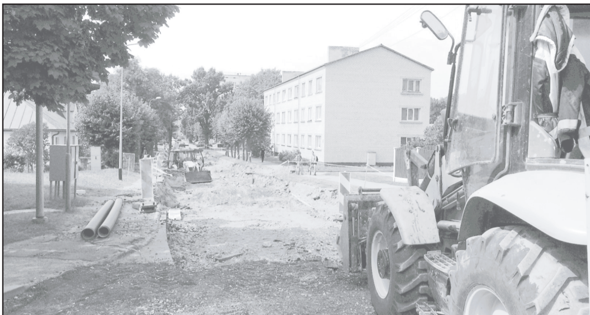
Krasta ielā notiek būvdarbi.

Kopš jūlija beigām tiek veikti rekonstrukcijas darbi Zaļajā ielā no Krasta ielas līdz Ķiršu ielai un Krasta ielā no Zaļās ielas līdz Skolas ielai.