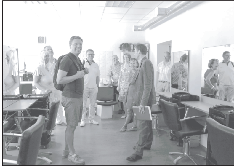
Dobeles Amatniecības un vispārizglītojošajā vidusskolā viesi no Engelholmas kopā ar skolas un pašvaldības pārstāvjiem priecājas par labi aprīkoto mācību kabinetu.

Ciemi dienās Engelholmas pašvaldības delegācijas programmu bagātināja arī piedalīšanās Dobeles Senās pils svētku pasākumos, kā arī Siguldas un Rīgas apskate. Tā kā lielākā delegācijas daļa - trīs cilvēki - bija pirmo reizi ne tikai Dobelē, bet vispār Latvijā, viņi bija ļoti iepriecināti par iespēju