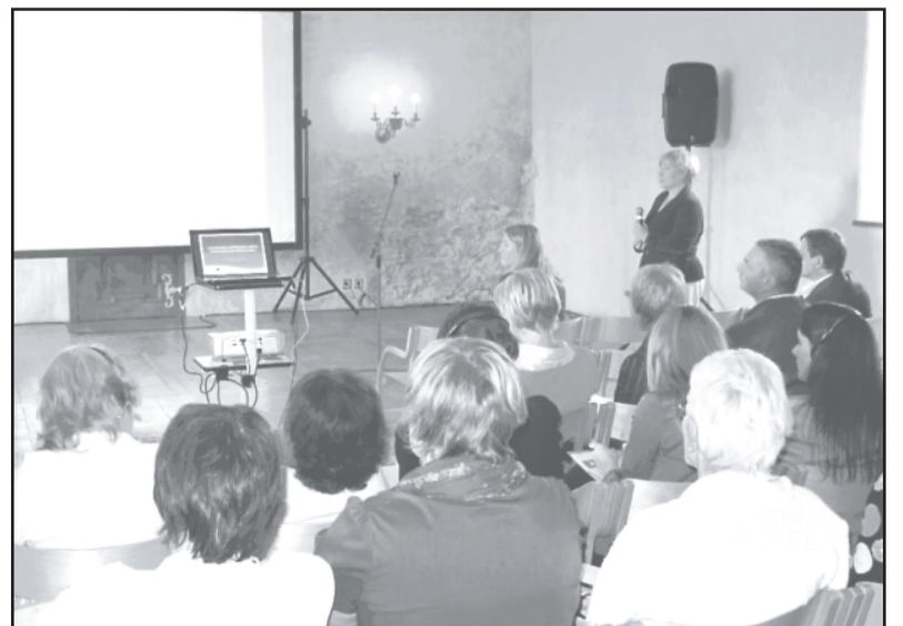
Projekta noslēguma konference Bauskas pili.

Dobeles novada pašvaldības projektu vadītāja