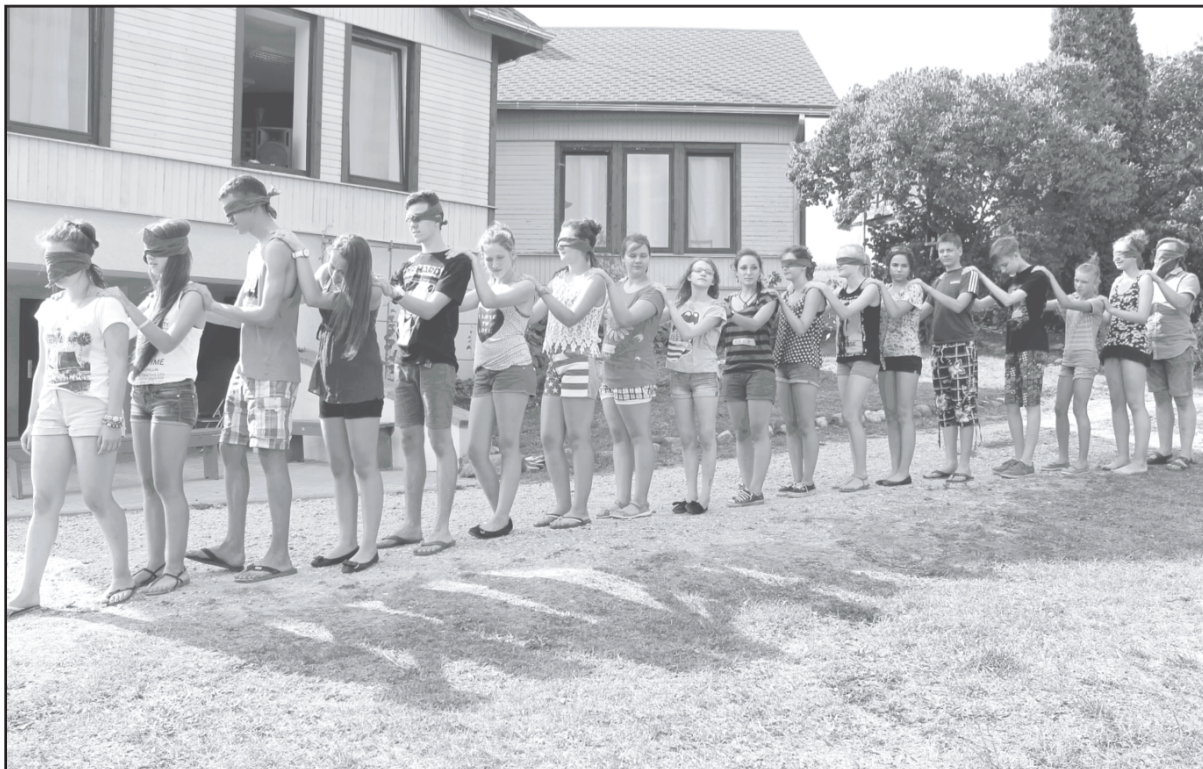
Nometne jauniešiem par uzņēmējdarbību «Tent - terentent 4» šī gada augustā.

Ar izsoles noteikumiem interesenti var iepazīties Dobeles novada pašvaldībā, Brīvības ielā 17, Dobelē, darba dienās no plkst. 8.00 līdz 17.00. Uzziņas par tālruni 63720938 vai 26326880.