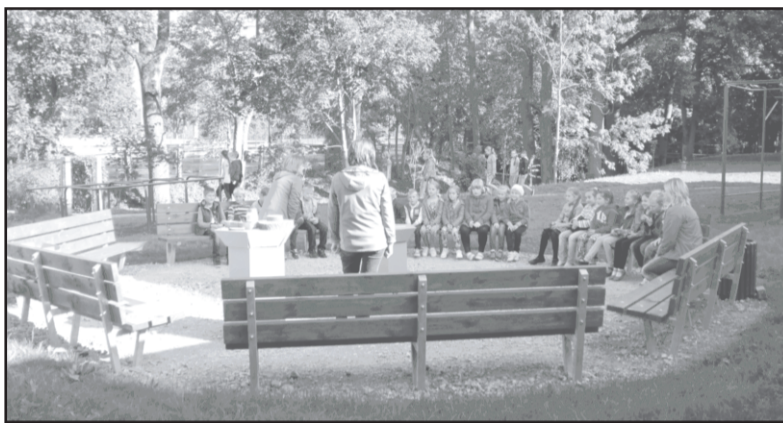
Mācību stunda «zaļajā klasē».

Ir noslēgušās visas Latvijas Vides aizsardzības fonda (LVAF) līdzfinansētā projekta «Vides izglītībai piemērotas vides izveide Dobeles 1. vidusskolas teritorijā» (R. nr. 1-08/144/2014) plānotās aktivitātes. Projekts norisinājās no šī gada 2. maija līdz 30. oktobrim ar kopējo finansējumu 9333 EUR, no tiem 7000 EUR ir LVAF finansējums un 2333 EUR - Dobeles novada pašvaldības līdzfinansējums.