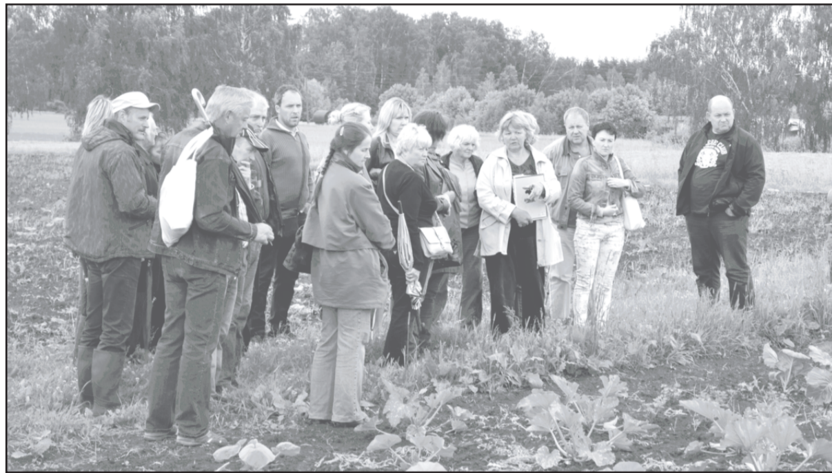
Kursu dalībnieki iepazīstas ar bioloģiskās lauksaimniecības produkcijas ražošanu zemnieku saimniecībā «Vizbuļi», Penkulē.

Dobeles Pieaugušo izglītības un uzņēmējdarbības atbalsta centrs (Dobeles PIUAC) šī gada laikā uzņēmējdarbības jomā ir strādājis ar dažādām mērķa grupām: mazie un vidējie uzņēmēji, jaunieši un topošie uzņēmēji. Ņemot vērā, ka mūsu novads lepojas ar spēcīgu lauksaimniecības produkcijas ražošanu, īpaši pievēršamies esošajiem un topošajiem mājražotājiem.