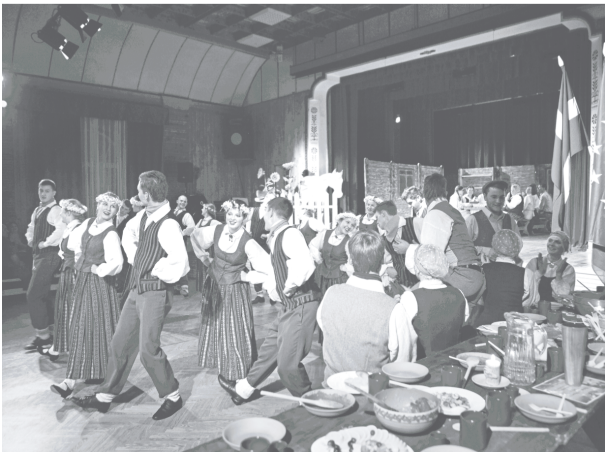
Ražas svētki Penkulē.