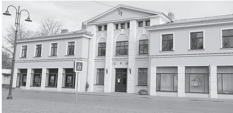
Dobeles kultūras nama uzpostā fasāde.

Šajā gadā pašvaldība, piesaistot arī uzņēmēju līdzekļus, ir gan pabeigusi, gan turpina strādāt pie dažādiem objektiem Dobeles novadā.