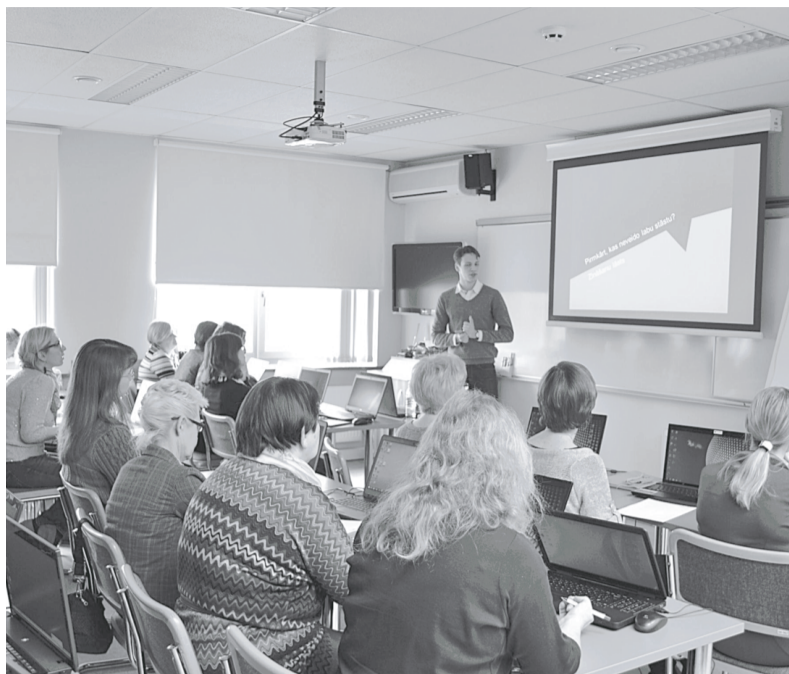
Nodarbība Dobeles PIUAC «E - prasmju nedēļā 2015».

Gados jaunākiem ļaudīm, kuri gatavojas kļūt par vecākiem, piedāvājam semināru ciklu «Topošo vecāku skola». Šosezon uzsāksim jauna satura nodarbības par slingu veidiem (apsējs/lakats/šalle jeb taisn-