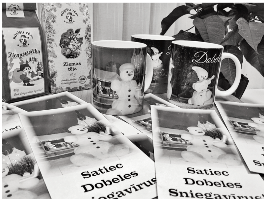
Daļa no suvenīru klāsta.