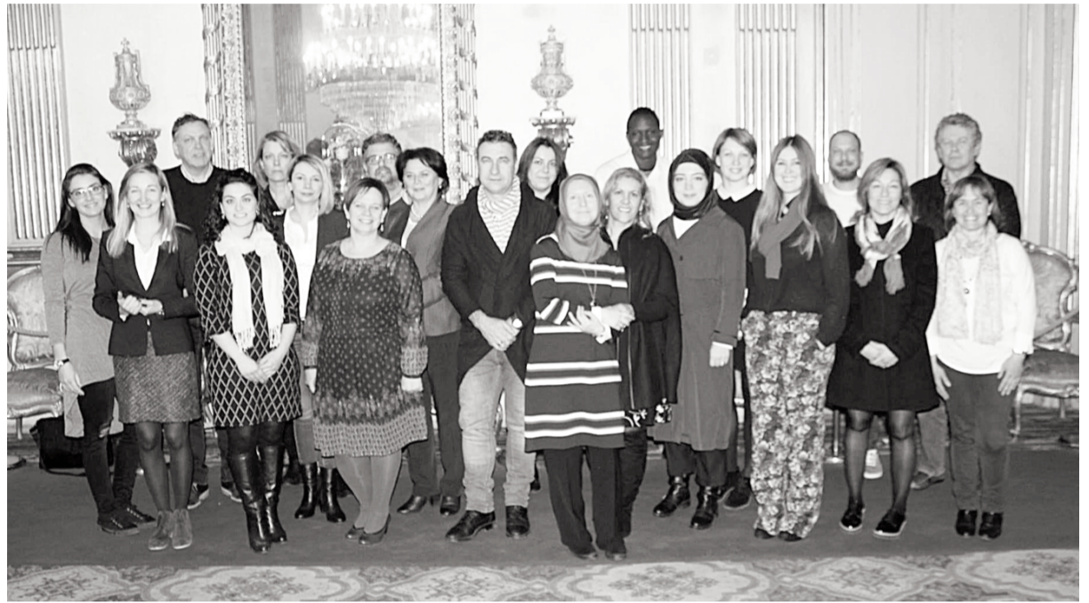
Projektu partneru tikšanās Spānijā.

Dobeles novada pašvaldība ir saņēmusi datu apkopojumu par veikto anketēšanu Dobeles novada skolās projekta «Jaunatne Eiropā. Preventīvie pasākumi atkarību veicinošo vielu samazināšanā jauniešu vidū» ietvaros.