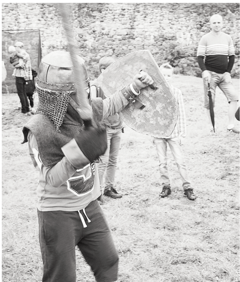
Pagājušās nedēļas nogalē Dobelē tika aizvadīti Senās pils svētki.

Nāc, un mēs tev palīdzēsim kļūt par īstu profesionāli!