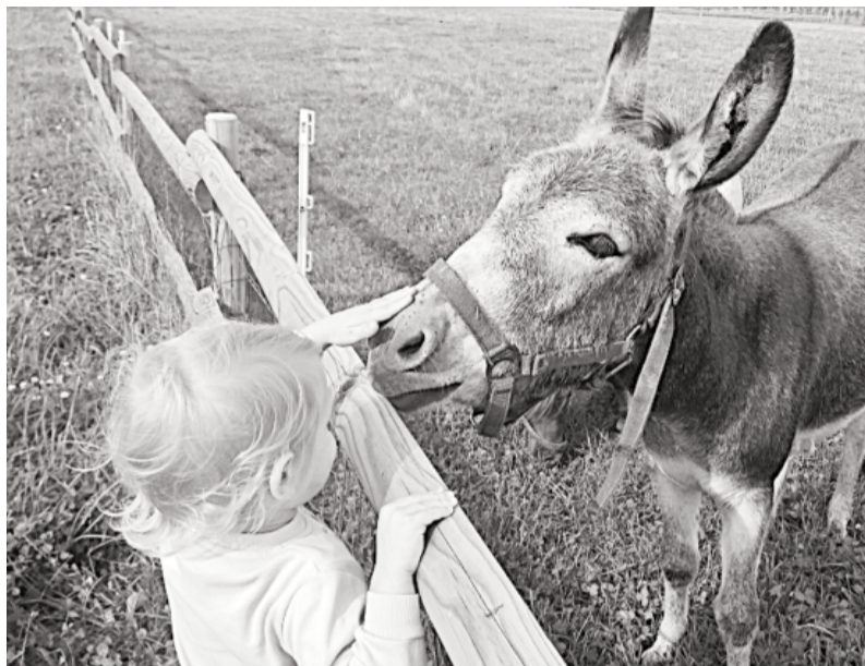
Penkules lauku sētā «Ozoliņi».