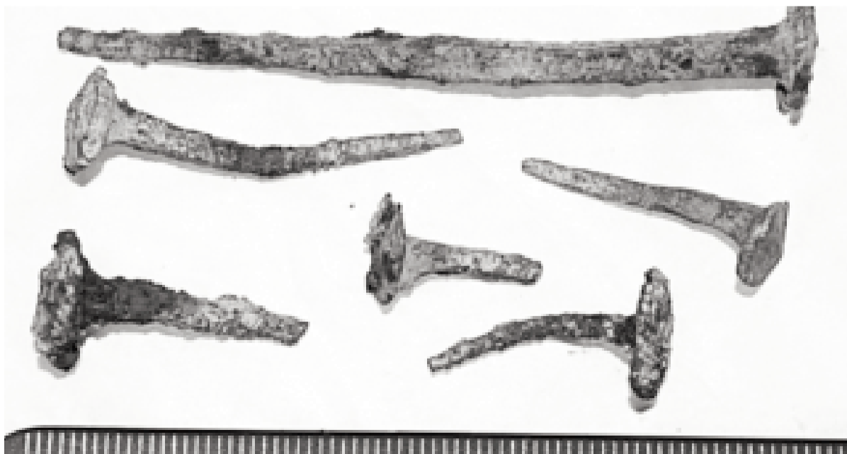
Būvdarbos izmantotas kaltas naglas.