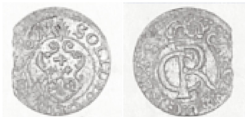
Zviedrijas karaļa Kārļa XI valdīšanas laikā (1660 - 1697) Rīgā 1661. gadā kalts šiliņš.