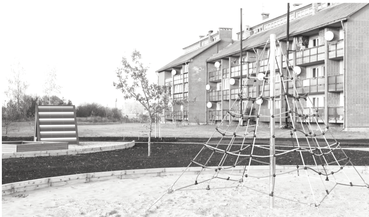
Šodien paredzēts laukumu atklāt.

Dobeles novada pašvaldības projektu vadītāja