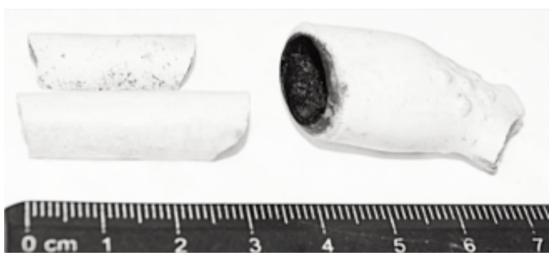
Baltmāla pipes fragmenti - 17. gs.