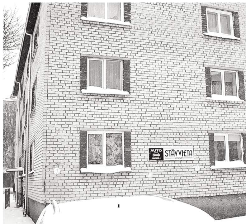
Muldavas ielā 4 tika sakrāta nauda jumta seguma nomaiņai.

Esam priecīgi sagaidījuši Jauno gadu, un gadu mija tradicionāli ir tas laiks, kad izvērtējam aizvadīto gadu un ar lielām cerībām skatāmies nākotnē. Arī SIA «Dobeles namsaimnieks» vērtē savu darbību iepriekšējā periodā un kaļ plānus jaunajam gadam.