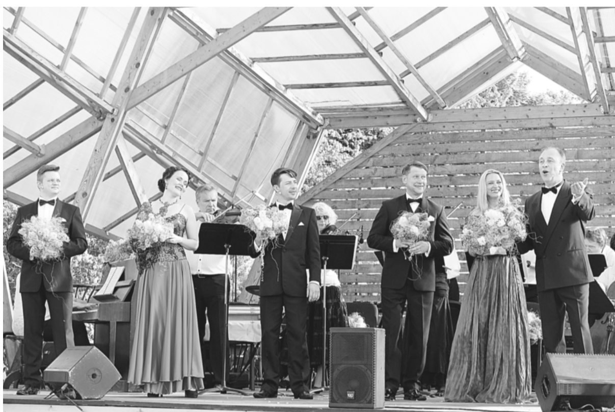
Latvijas Nacionālās operas mākslinieki Ceriņu koncertā Dobeļē 2016. gadā.

Latvijas valsts jubilejas svētku programmu ieskandinot un atzīmējot Dobelei piešķirto pilsētas tiesību simtgadi, Ceriņu svētki Dobeles novadā šogad notiks no 26. līdz 28. maijam. Svētku programma ir plaša un interesanta - katrs noteikti atradis sev kaut ko piemērotu un aizraujošu.