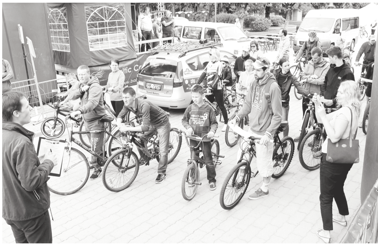
Veselību veicinošas aktivitātes Dobelē.