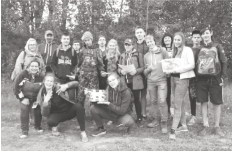
2016. gada nometnes dalībnieki gatavi doties nakts orientēšanās pārgājienā. Tā bija augusta aukstākā nakts, taču skaistākā, jo jaunieši piedzīvoja bagātīgu zvaigžņu lietu.