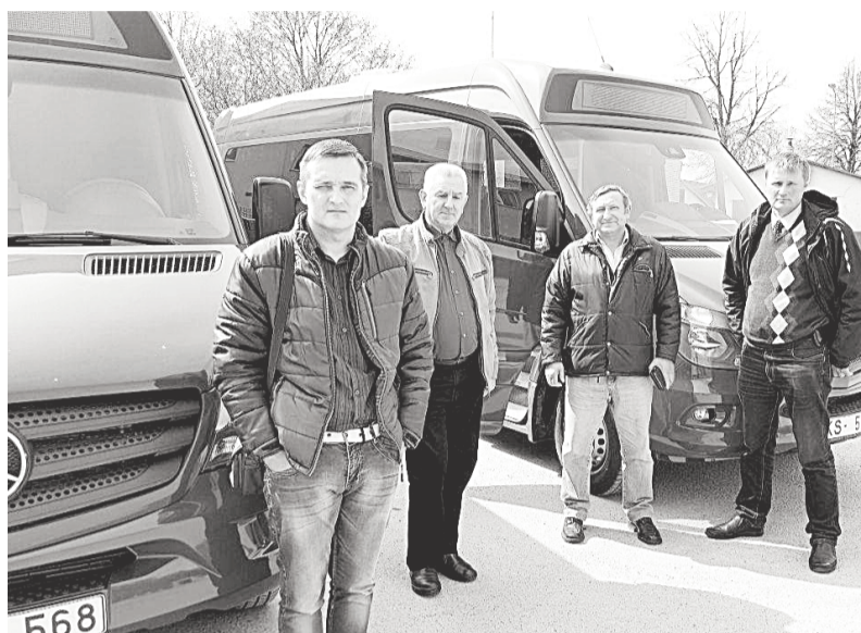
Autobusu parka šoferi priecājas par jaunajiem mikroautobusiem.

2017. gadā uzņēmums ir turpinājis darbu pie autobusu parka ritošā sastāva tālākas atjaunošanas. Pateicoties kapitālsabiedrības darbinieku ieguldījumam un kopīgam darbam, un sadarbībā ar lizinga uzņēmumiem SIA «Dobeles autobusu parks» ir veiksmīgi pietuvojies sava vidējā termiņa stratēģijas plāna īstenošanai autobusu parka atjaunošanā un veicis investīcijas, kas trīs gadu laikā pārsniedz 1,2 miljonus