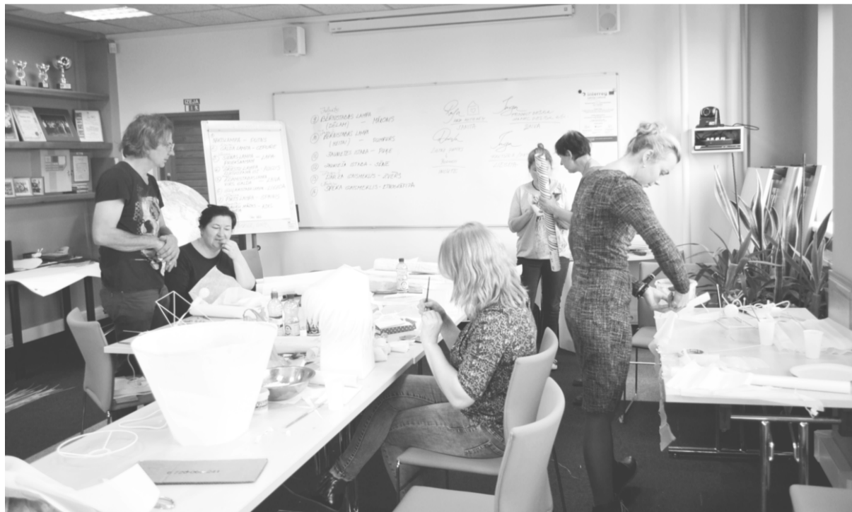
Papīra darbnīca Dobeles PIUAC.

Šis raksts ir sagatavots ar Eiropas Savienības finansēto atbalstu. Par šī raksta saturu pilnībā atbild Dobeles Pieaugušo izglītības un uzņēmējdarbības atbalsta centrs, un tas nekādos apstākļos nav uzskatāms par Eiropas Savienības oficiālo nostāju.