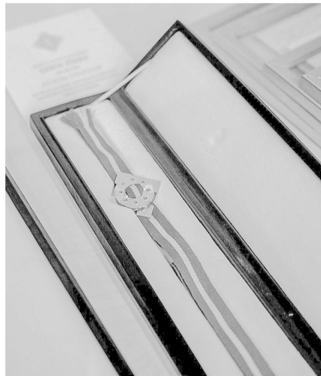
Dobeles novada pašvaldības augstākais apbalvojums – GODA ZĪME.

Tomēr pašvaldība, vēloties ar pienācīgu cieņu un godu pasniegt Dobeles novada apbalvojumus šā gada laureātiem, svinīgo pasākumu organizēs iespējami vistuvākajā laikā, par to iepriekš informējot apbalvojumu saņēmējus un aicinātos viesus.