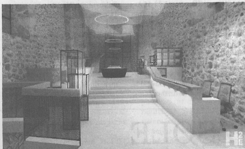
Dobeles pils kapelas iekštelpas vizualizācija