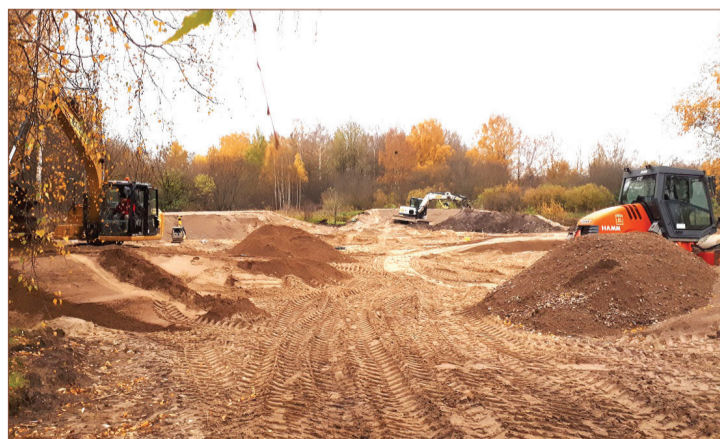
Topošā velotrase Dobelē, Jāņa Čakstes ielā 11.

2021. gada 22. aprīlī Dobeles novada pašvaldībā tika parakstīts līgums ar firmu SIA "We Build Parks" par velotrases pro-