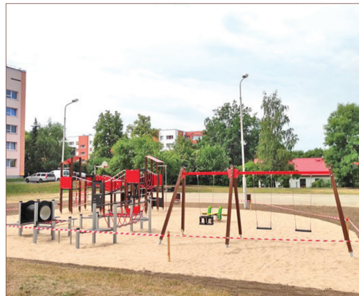
Atjaunotais bērnu rotaļu laukums Skolas ielā 37A.

(posmā no Viestura ielas 5 līdz Brīvības ielai).