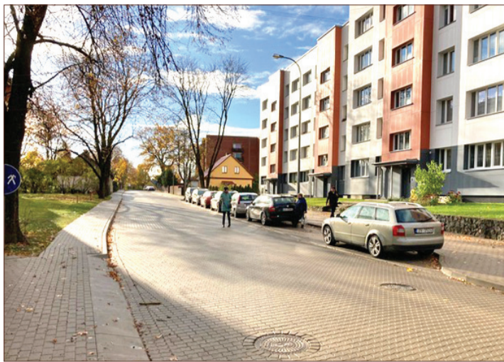
Tagad Skolas ielu visā tās garumā sedz bruģa klājums.

• Meža prospektā 54 atjaunota vingrošanas zona, kur līdzās jau esošajam vingrošanas iekārtām tika uzstādītas jaunas: multifunk-