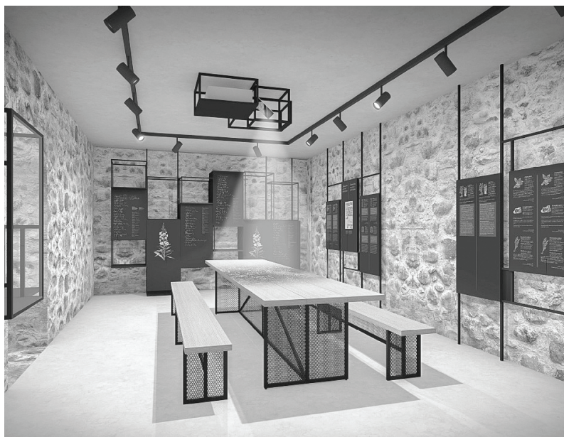
Ilustrāciju izstrādāja SIA H2E design.