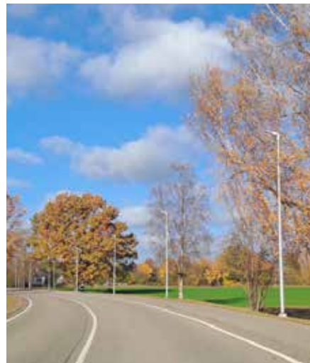
Apgaismojuma izbūve gājēju ietvei Vītiņu pagastā.

ļus, lai varētu veikt vienotu gaismekļu dimmēšanu. Šobrīd vēl tiek kārtota dokumentācija (atzinumu saņemšana) objekta nodošanai ekspluatācijā.