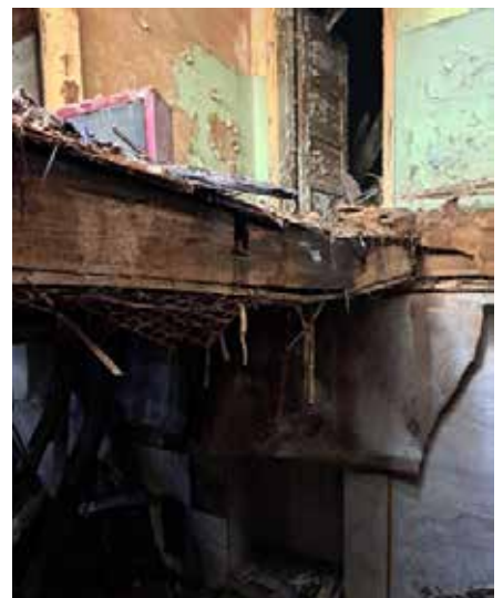
Avārijas stāvoklī esošās būvkonstrukcijas Brīvības ielā 1, Dobelē.