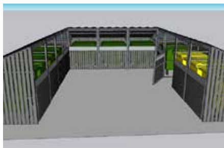
Atkritumu konteineru novietnes modelis.

Ņemot vērā interesi no iedzīvotājiem ar vēlmi uzlabot atkritumu konteineru novietņu stāvokli Dobeles pilsētā, sadarbībā ar vides dizaineri ir tapis vienots koncepts šo konteineru novietnēm, kā arī noslēgts līgums ar SIA "AB metāls" par 11 moduļu izgatavošanu un uzstādīšanu Jāņa Čakstes ielā 20, Dobeļē. Paredzēts, ka katram konteineram būs savs modulis, kurus iespējams kombinēt pēc nepieciešamības (izvērtējot konkrētās novietnes gabarītmērus). Viena moduļa izmaksas ir 654 eiro bez PVN. Līdz gada beigām plānots noformēt dokumentāciju, un tā tiks publicēta pašvaldības mājaslapā, kas kalpos kā tipveida paraugs iedzīvotājiem.