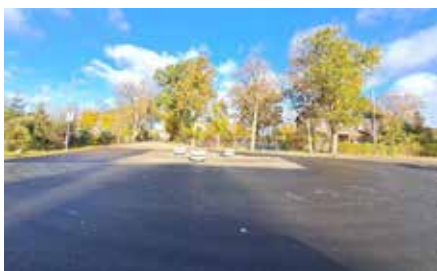
Atjaunotais asfalta segums Auces pilsētā.

Penkules un Naudītes pagastu apvienības pārvalde ir noslēgusi līgumu par Naudītes ciema pieturas pārvietošanas un labiekārtošanas darbu veikšanu, darbu veicējs – SIA “Rotas” un kopējā līguma cena 3232,20 eiro bez PVN.