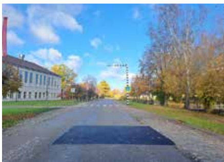
Atjaunotais asfalta segums Auces pilsētā.