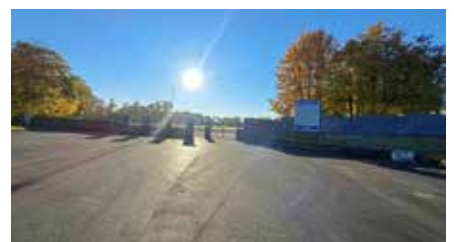
Atjaunotais asfalta segums stāvlaukumā pie Dobeles pilsētas stadiona.