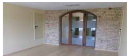
Iekštelpas pēc pārbūves.

Elvija Namsone, Dobeles novada Centrālās pārvaldes Infrastrukturās nodaļas vadītāja, sertificēta būvzinieciere