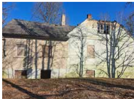
Skats uz Brīvības ielas 1 nojaukamo ēku Dobelē.

Beidzot ir saņemti visi nepieciešamie saskaņojumi no institūcijām, lai varētu uzsākt ēkas demontāžas un teritorijas labiekārtošanas darbus. Rīkotās cenu aptaujas rezultātā saimnieciski izdevīgākais piedāvājums tika saņemts no SIA "Rotas", noslēgtā būvdarbu līguma summa 18 964,00 eiro bez PVN. Būvdarbi tiks uzsākti novembra sākumā pēc Nacionālā kultūras mantojuma pārvaldes prasību izpildes, proti, pēc iespējas saglabāt ēkas būvdetaļas (piemēram, kāpņu margas, kāpnes) un nodot tās Dobeles muzejam.