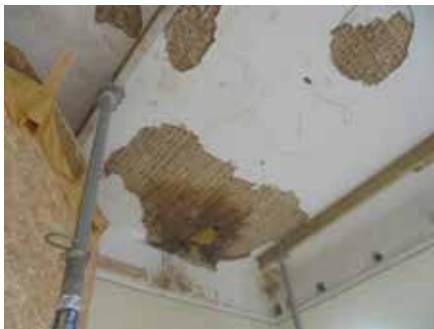
Riņģīša griestu demontāža.