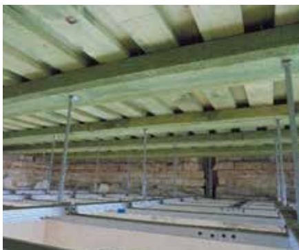
Otrā stāva metāla dubultais karkass.