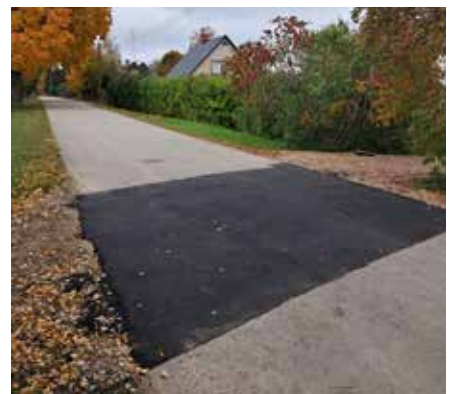
Atjaunotais asfalta seguma posms Miltiņu ciemā, Bērzes pagastā.