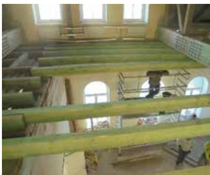
Pārseguma siju montāža.