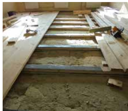
Dēļu grīdas būvdarbi.