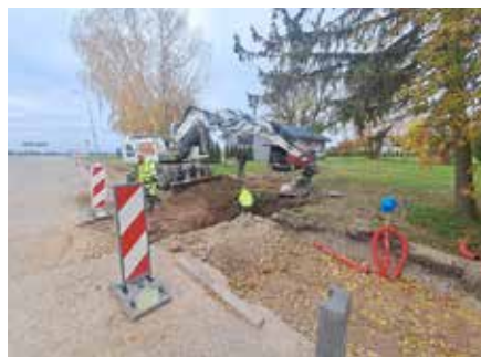
Gājēju celiņa izbūves darbi Penkulē, Penkules pagastā.

Noslēgušies ielu seguma atjaunošanas darbi Dobeles un Auces pilsētās, Miltiņu ciemā, Bērzes pagastā. Dobeles pilsētā tika atjaunots Bērzes ielas brauktuves segums vairāk nekā 3500 m 2 platībā, izbūvējot karstā asfalta AC 8surf dilumkārtu 4 cm bie�umā. Tika veikta 7 virszemes ūdens savākšanas gūlīju pacelšana un 7 komunikāciju aku vāku augstuma regulēšanas darbi Bērzes ielā, Brīvības ielā pie dzelzceļa un Zaļā ielā.