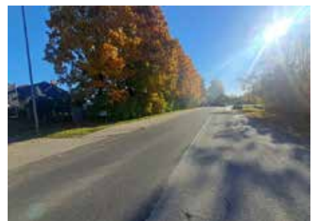
Atjaunotais asfalta segums Bērzes ielā, Dobeļē.

Auces pilsētā tika atjaunots Raiņa ielas, Jura Mātera ielas, 1. Maija ielas un Stacijas laukuma segums kopā vairāk kā 1200 m 2 platībā. Tika veikta 12 komunikāciju aku vāku augstuma regulēšana un 2 virszemes ūdens savākšanas gūlīju pacelšanas darbi. Atbilstoši iepirkuma procedūras rezultātiem būvdarbus veica SIA "Valkas ceļi". Šobrīd tiek veikta dokumentācijas sakārtošana un pieņemšanas–nodošanas aktu saskaņošana. Kopējās veikto darbu izmaksas ap 205 765 eiro ar PVN.