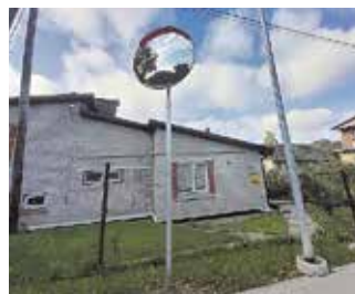
Ceļa satiksmes spogulis Liepu ielas un Meža prospekta krustojumā, Dobeļē.