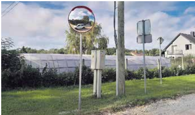
Ceļa satiksmes spogulis Sanatorijas ielas un Meža prospekta krustojumā, Dobeļē.

Septembra beigās Dobeles pilsētā Bērzes ielā ir uzsākti ielas seguma virskārtas atjaunošanas darbi. Būvdarbus veic būvuzņēmējs SIA “Valkas ceļi” (reģ. Nr. 44103112575). Šobrīd ir veikti asfalta seguma nofrēzēšanas darbi. Transportlīdzekļu kustība tiek saglabāta, transporta plūsmu novirzot pa vienu braukšanas joslu, bet darbu laikā ir jāreķinās ar iespējamiem satiksmes ierobežojumiem. Lūdzam iedzīvotājus izturēties ar sapratni un sekot līdzī ceļu satiksmes organizācijai! Oktobra sākuma ielas seguma asfaltēšanas darbi plānoti arī Miltiņos, Bērzes pagastā, kur agrā pavasarī tika veikti meliorācijas sistēmu avārijas likvidēšanas darbi. Par darbu gaitu detalizētāka informācija sekos nākošajā “Dobeles Novada Ziņu” numurā.