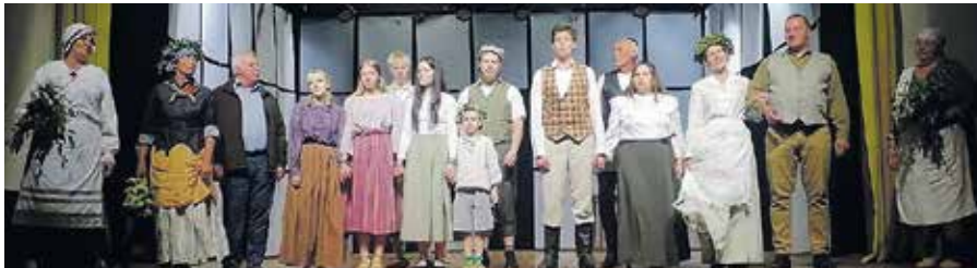
Mirklis pēc Rūdolfa Blaumaņa lugas "Skroderdienas Silmačos" ģenerālmēģinājuma Tērvetes Kultūras namā.