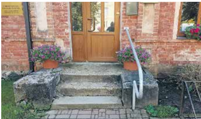
Penkules un Naudītes pagastu apvienības pārvaldes ēkas ieejas mezgls pirms pārbūves.