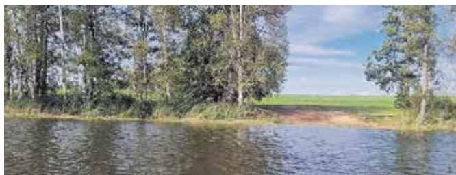
Ūdenstilpnes attīrīšana Apguldes ezerā, Naudītes pagastā.