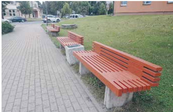
Jaunie atpūtas soli Dobeles pilsētā.

Dobeles Ķestermeža teritorijā tika veikta atpūtas soliņu atjaunošana, savukārt Dobeles pilsētā Uzvaras–Brīvības ielā pretī pulkstenim–strūklakai tika veikta četru veco koka solu demontāža, jaunu solu izgatavošana un montāža, koka virsmu krāsošana aptuveni 14,0 m 2 lielā virsmā. Darbus veica pašvaldības kapitālsabiedrība SIA "Dobeles namsaimnieks", darbu izmaksas – 1097,02 eiro ar PVN.