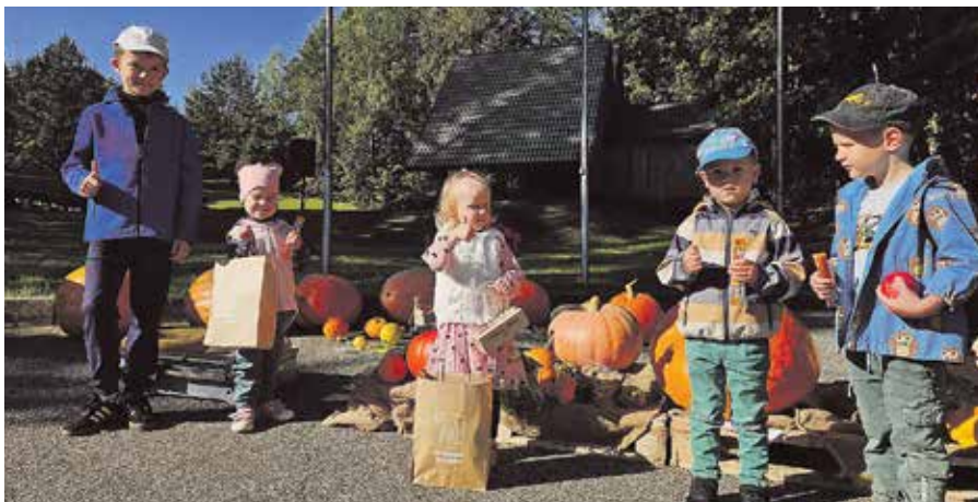
Dižķirbju konkursa pirmo trīs vietu ieguvēji.