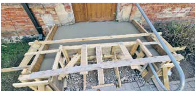
Penkules un Naudītes pagastu apvienības pārvaldes ēkas ieejas mezgls pārbūves darbu gaitā.