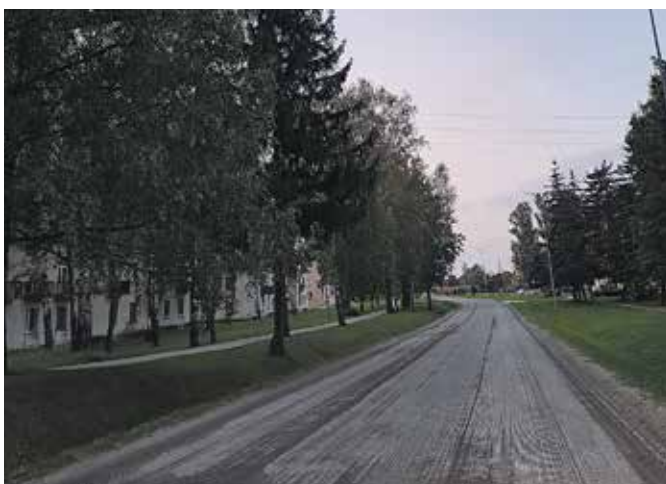
Bērzes ielas seguma virskārtas atjaunošanas darbi Dobeles pilsētā.

Ir izsludināta iepirkuma procedūra par Dobeles novada pašvaldības autoceļu un ielu ikdienas uzturēšanu ziemas sezonā. Tehniskā specifikācija sadalīta 24 daļās, attiecīgi izdalot pilsētu, pagastu teritoriju robežas, kā arī autoceļu un ielu slīdamības samazināšanas darbus novada pagastu teritorijās. Iepirkuma atvēršana paredzēta 23. oktobrī, pēc tā izvērtēšanas būs zināmi attiecīgo daļu līguma slēgšanas tiesības ieguvušie pretendenti.