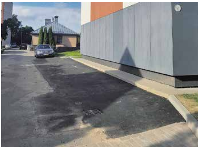
Būvdarbi un atjaunotais segums pie dzīvojamās mājas Skolas ielā 14, Dobelē.

Septembrī tika izvērtēti izsludinātā iepirkuma pieteikumi par meliorācijas sistēmu atjaunošanu un būvdarbiem Naudītes un Zebrenes pagastos.