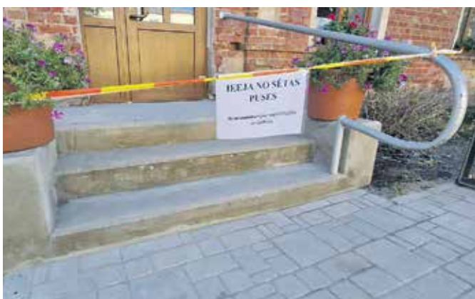
Penkules un Naudītes pagastu apvienības pārvaldes ēkas ieejas mezgls pēc pārbūves.

Ir pabeigti granulu apkures katla "GRANDEG Turbo 200kW" remonta darbi ar degļa nomaiņu katlu mājā "Labrenči", Tērvetes pagastā. Tika veikta apkures katla esošā degļa demontāža, montāža, ieregulēšana, darbības pārbaude un nodošana ekspluatācijā pēc remonta. Darbu veicējs SIA "Grandeg Serviss" par summu 6354,40 eiro ar PVN.