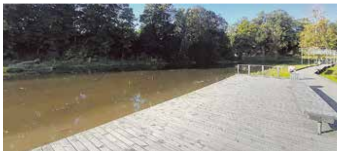
Ūdenstilpnes attīrīšana Pļavas ielā, Dobelē.

Darbi noslēgušies Pļavas ielā, Dobelē, attīrot Bēzres upes krastu aptuveni 300 m garā posmā, kā arī tuvāko dienu laikā attīrīšanas darbi tiks pabeigti Naudītes pagasta Apguldes ezerā, kur tiek attīrītas trīs vietas pie ezera (kopējā platībā 1,0 ha). Ūdenstilpņu attīrīšana tālāk pēc grafika tiks veikta arī Naudītes ūdenskrātuvē, Auces pilsētā (attīrot parka diķi Bēnes ielā 2 un diķi blakus Auces vidusskolai Jura Mātera ielā 11), kā arī Dobeles pagasta Gaurata ezerā (pārtīrāmā platība 1,0 ha; plānots pārtīrīt vienu krastu). Darbu veikšanu nodrošina SIA "Piekraiste.lv", kopējā līguma summa ir 9440,90 eiro (ar PVN).