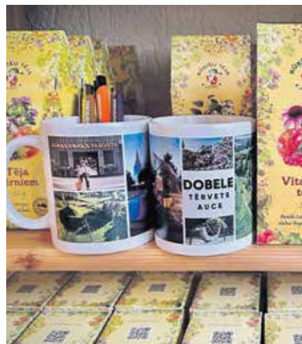
Dobeles novada Tūrisma informācijas centrā papildināts suvenīru klāsts.

Tūrisma informācijas centrā (TIC) pieejami magnēti, pildspalvas, krūzes un pie rakstu bločiņi. Iegādājamas arī skaistas pastkartes un plašs sortiments ar zemnieku saimniecības “Rūķišu tēja” tējām un citiem šīs saimniecības produktiem, kas sildīs drēgnajās rudens dienās.