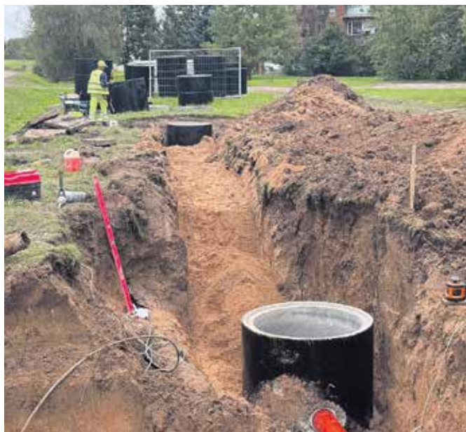
Gājēju celiņa remontdarbi Penkulē.

Jaunais gājēju celiņš atbilstoši SIA "JB Latvija" izstrādātajam būvprojektam plānots blakus autoceļam V1126 "Dobeļe–Penkule" kreisajā pusē. Projekta ietvaros paredzēts izbūvēt jaunu gājēju ietvi, kas atbilst normatīvo aktu prasībām. Gājēju ietve tiks veidota 2,00 m plata ar bruģakmens segumu un kopējais ietves platums būs 2,23 m, kas nodrošinās komfortablu tās izmantošanu. Tāpat projekta risinājumi ietver jaunu ielu apgaismojuma izbūvi, kopā paredzot 10 jaunus apgaismojuma elementus. Ir arī ieprojektēts izveidot lietus ūdens uztveršanas sistēmu, kas savāks jaunizbūvēto gājēju celiņa ūdens plūsmu. Šobrīd ir saņemti būvniecības dalībnieku dokumenti (atļaujas, apdrošināšanas polises, atbildīgo būvspeciālistu rīkojumi) un izsniegta būvdarbu uzsākšanas nosacījumu izpildes atzīme būvatļaujā, kas nozīmē, ka oktobra sākumā jau uzsākti būvdarbi.