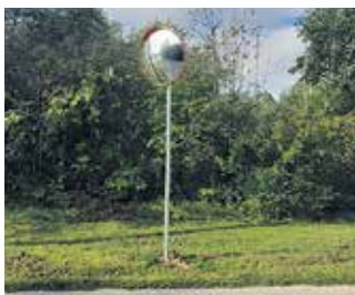
Ceļa satiksmes spogulis Mazās meža ielas un Meža prospekta krustojumā, Dobeļē.