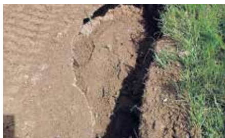
Autoceļa Nr. 6005 izskalojums pēc vētras Dobeles pagastā.