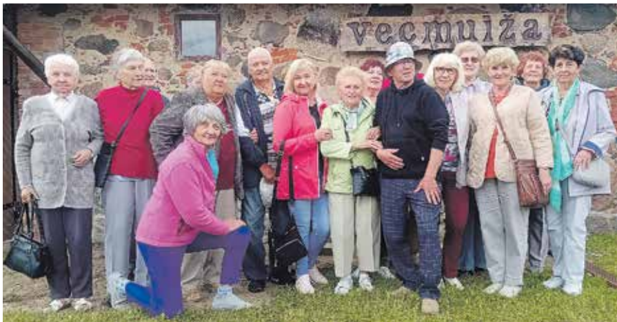
Dienas centra “Stariņš” aktīvie seniori ekskursijā.

Dienas centrā aktīvi darbojas arī “Stariņa” senioru vokālais ansamblis “La Si Do”, plānojamot jaunu dziesmu repertuāru un to pamazām apgūstot. Vasarā ansamblis aicināja pie sevis uz Dobelē sadraudzības pasākumā senioru vokālo ansambli “Varavīksne” no Elejas. Dziedātājas svinēja ansambļu satikšanās svētkus un pavadīja laiku dažādās muzikālās aktivitātēs un savstarpējās sirsnīgās sarunās.