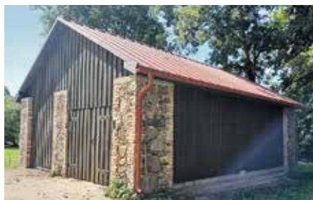
Pārbūvētais šķūnis "Alejās", Bikstos.

Noslēgušies SIA "DOBELES ŪDENS" veiktie kanalizācijas septiņa demontāžas darbi Bēnē. Kopējās darbu izmaksas ir 34 987 eiro ar PVN. Kapitālsabiedrība ir veikusi visus ar rakšanu saistītos darbus, atlikusi seguma sakārtošanu (bortakmeņi, asfalta segums, zālāja atjaunošana).