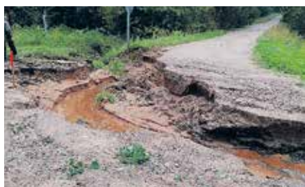
Autoceļa Nr. Te22 izskalojums pēc vētras Tērvetes pagastā.

Autoceļu posmu izskalojumi novērsti, veicot ceļa segas atjaunošanu ar grants – šķembu maisījumu.