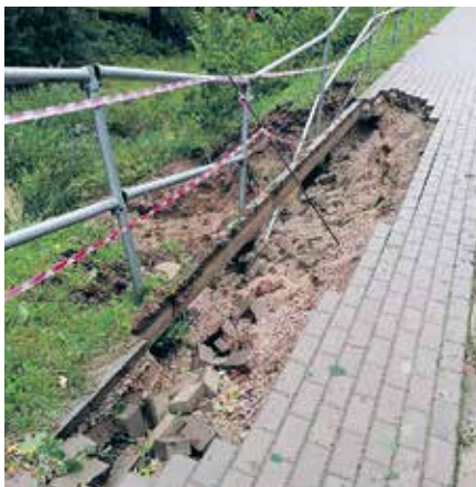
Gājēju celiņš gar valsts autoceļu P103 pēc vētras.