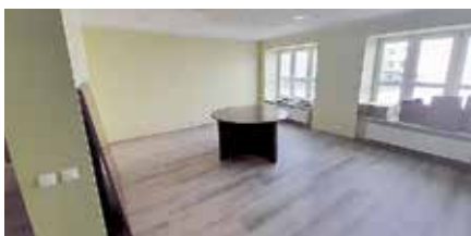
Dobeles Valsts ģimnāzijas administrācijas telpa.

dienesta darbinieku kabinetu. SIA "Pekaiņi" veica grīdas betonēšanas darbus 55 m 2 platībā: pamatnes izlīdzināšana un piebēršana, hidroizolācijas membrānas iestāde, putupolistirola EPS150 ieklāšana un grīdas betonēšana. Līguma izmaksas: 2493 eiro (bez PVN). Savukārt pārējos remonta darbus, santehnikas un elektroinstalācijas darbus nodrošina pašvaldības speciālisti (remontstrādnieki, elektrotehniķi).