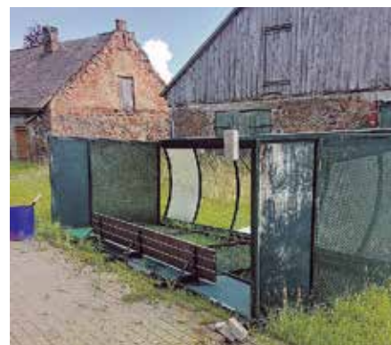
Autobusu pieturvietas “Līvi” nojume Bikstos, Bikstu pagastā.

Darbus veica SIA “Varpet”, līgumcena: 10 038 eiro (bez PVN).