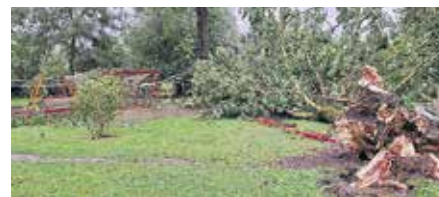
Vētras postījumi Krimūnās.

Jūlija beigās un augustā labiekārtošanas darbi tika veikti, lai galvenokārt novērstu vētras radītās sekas – tika vākti gāztie koki visā novada teritorijā. Krītot kokiem, tika nodarīti postījumi ne vien ielu apgaismojumam, bet arī apkārtējai publiskai teritorijai – gājēju celiņiem, teritorijas nožogojumam, ēku jumtiem, atpūtas parkiem un laukumiem. Darbus veica gan pašvaldības kapitālsabiedrības SIA "Dobeles komunālie pakalpojumi" un SIA "Auces komunālie pakalpojumi", gan arī piesaistītie ārpusvalsts pakalpojuma veicēji. Dažviet darbi vēl turpinās un izmaksu aplēses līdz ar to arī tiks apkopotas vēlāk.