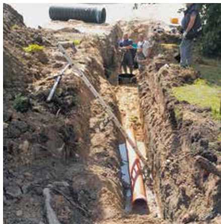
Bēnes kanalizācijas septiņa demontāža.

ikmēneša maksājumu par elektrības sadales un pārvades pakalpojumiem, kas radīs papildu ekonomiju.