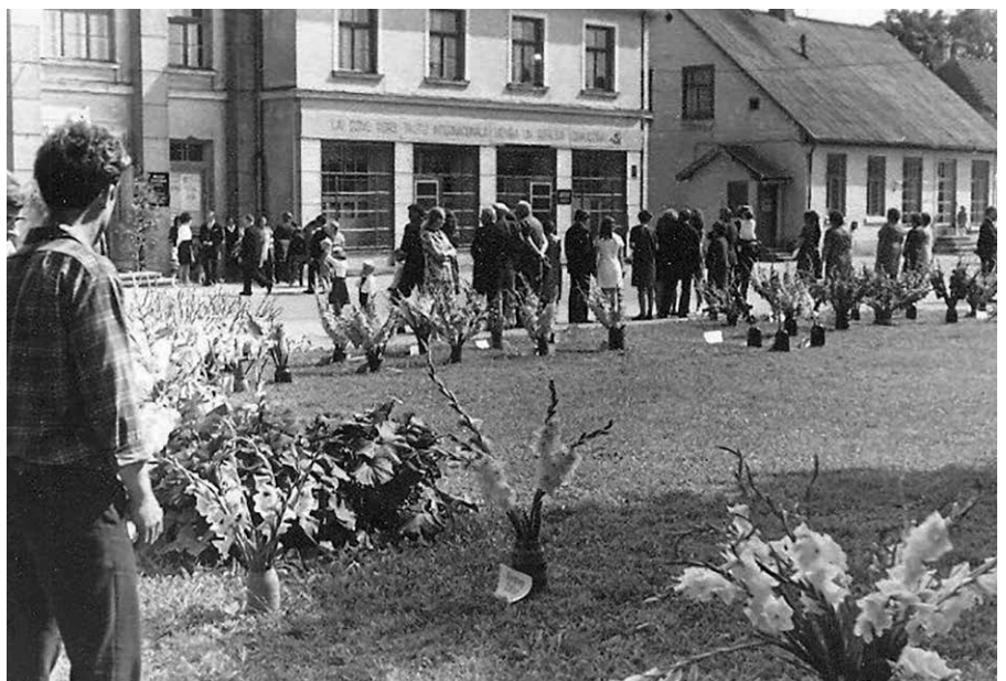
Dobeles pilsētas Kultūras nams vienmēr bijusi vieta, kur dobelnieki un pilsētas viesi mīļējuši baudīt kultūras pasākumus.

Dobeles pilsētas Kultūras nama pasākumu producete