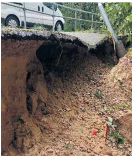
Gājēju celiņš gar valsts autoceļu P103 pēc vētras.

Visvairāk defektu vētra radījusi Tērvetes pagasta gājēju celiņam gar valsts autoceļu P103 Dobeļe–Baуска. Uzkrītot vētras gāztiem kokiem, bojātas ceļu drošības barjeras aptuveni 30 metru garumā. Bija izveidojies spēcīgs izskalojums gan gājēju celiņa asfalta seguma posmā, gan bruģakmens seguma posmā, sabojājot asfaltbetona seguma virsmu vairāk nekā 15 m 2 platībā un bruģakmens segumu ap 15m 2 . Tāpat tika nogāzta ielu apgaismojuma laternas un neatgriezeniski sabojāti gaismekļi. Gājēju celiņa norobežojošās barjeras ir atjaunotas (nelielā posmā, kur nebija iespējama atjaunošana, tās uzstādītas jaunas). Bruģakmens seguma izskalojums novērsts, izbūvējot šķembu maisījuma pamatni, izlīdzinošo kārtu un izbūvējot bruģakmens segumu. Veikti nogāzes stiprināšanas darbi ar laukakmeņu bruģa segumu uz šķembu pamatnes cemen-