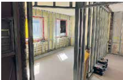
Būvdarbi Priezu ielā 21, Gardenē.

Būvdarbus veica SIA "JM būvniecība", līgumcena – 39 633 eiro ar PVN, būvuzraudzības pakalpojumus nodrošināja "Firma "MAGS"", līguma cena – 1940 eiro ar PVN.