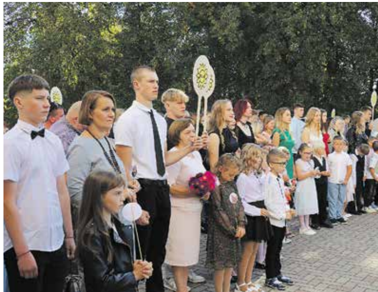
Mirkļis no Zinību dienas Auces vidusskolā.