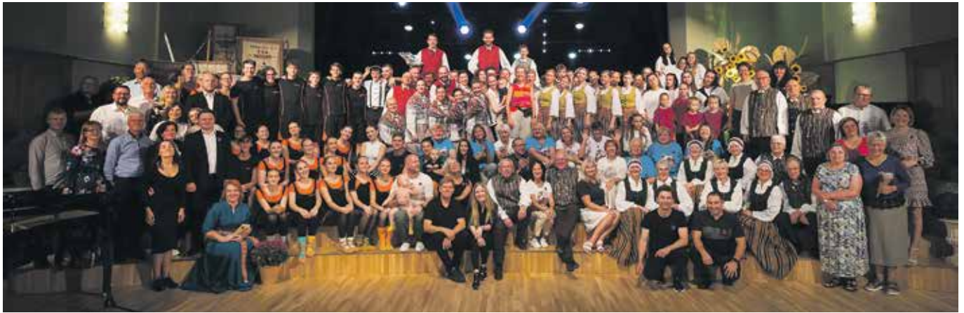
Dobeles pilsētas Kultūras nama 84. sezonas atklāšana.

Dobeles pilsētas Kultūras namam 2024. gada 24. septembrī aprit 85 gadi. Izceļot šo vēsturisko notikumu, 2024. un 2025. gada kultūras sezonu Dobeles pilsētas kultūras nams un tam piederīgie kolektīvi aizvadīs jubilejas zīmē. Sākot ar kultūras nama 85. kultūras sezonas atklāšanas pasākumu, līdz pat 86. jubilejai.