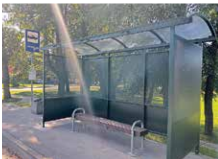
Autobusa pieturvietā Jaunbērzē.

Ielas segumu klāj asfaltbetons. Kopējā pārbūvētā brauktuves kvadrātūra ir 2683,4 m 2 , nomales platība – 45,13 m 2 . Satiksmes drošības uzlabošanai izbūvēti divi ātruma vaļņi no karstā asfalta AC11 surf. SIA “Ceļu būvniecības sabiedrība “Igate”” būvdarbus veica laika posmā no 2023. gada 30. oktobra līdz 2024. gada 20. jūnijam. Izpildīto darbu summa: 468 706,65 eiro bez PVN, no kuriem projektēšanas darbi – 12 200 eiro, būvdarbi – 453 306,65 eiro un autoruzraudzības darbi – 3 200 eiro bez PVN.