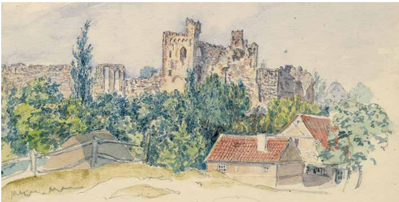
Zīmējuma autors – A.G.V. Pecolds. Dobeles pilsdrupas 1846. gadā.

Aizvadītā gada nogalē tapa Gunitas Zariņas populārzinātniskā monogrāfija “Dobeles 14.–17. gadsimta iedzīvotāji”.