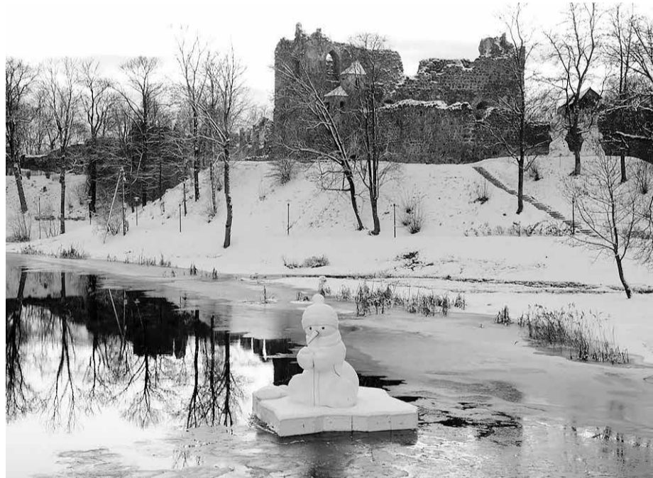
Jāņa vadībā pilsēta vairākus gadus spēja piesaistīt Dobeles tūristus, kurus interesēja te dažādās vietās aplūkojamās sniegavīru skulptūras.

Dobeles novada pašvaldības Sabiedrisko attiecību nodaļa