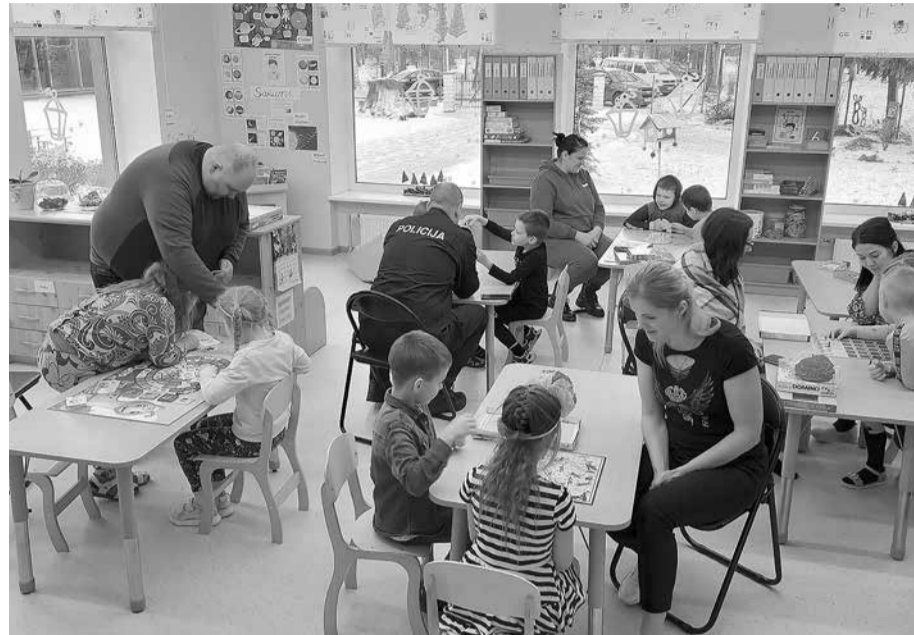
Nodarbībā strādā gan vecāki, gan bērni.

Visiem, lieliem un maziem, abas dienas izvērtās notikumiem bagātas. Bērni visu aizrautīgi baudīja, kā arī uzzināja un iemācījās