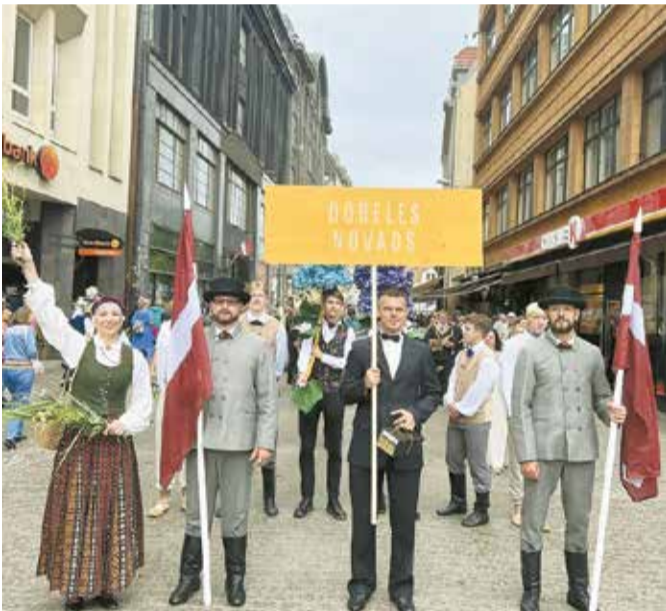
Kopumā 650 dalībnieku no 31 kolektīva pārstāvēja Dobeles novadu svētkos Rīgā.

Svētku nedēļas kulminācija bija noslēguma koncerts "Kopā Augšup". Tas veltīts dziesmusvētku tradīcijas 150 gadiem un reizē uzskatāms par tiltu uz nākamības svētkiem. Mežaparka Sidraba birzī pieredzējušu virsdiriģentu un Goda virsdiriģentu vadībā skanēja jauktie, sieviešu, vīru, senioru, bērnu un jauniešu kori, pūtēju orķestri un