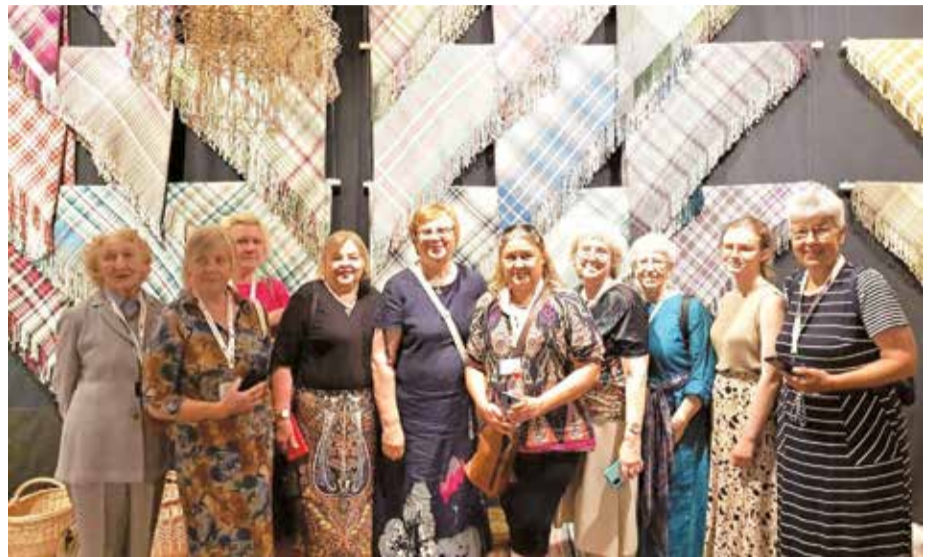
XXVII Vispārējais latviešu dziesmu un XVII deju svētku ietvaros Rīgā tika atklāta tautas lietišķās mākslas izstāde "Mēs". Ekspozīcijā skatāmas arī triju Dobeles novada tautas lietišķās mākslas studiju kolektīvu darinājumi. Izstādē piedalās TLMS "Avots", TLMS "Bēne" un TLMS "Auce", un tās apmeklētājiem izrāda Dobeles novada tradīcijām bagātu kultūras mantojuma saglabāšanas un veidošanas praksi. Izstāde skatāma Rīgā, Sporta ielā 2, līdz 30. jūlijam katru dienu, izņemot pirmdienas, no plkst.11 līdz 18.