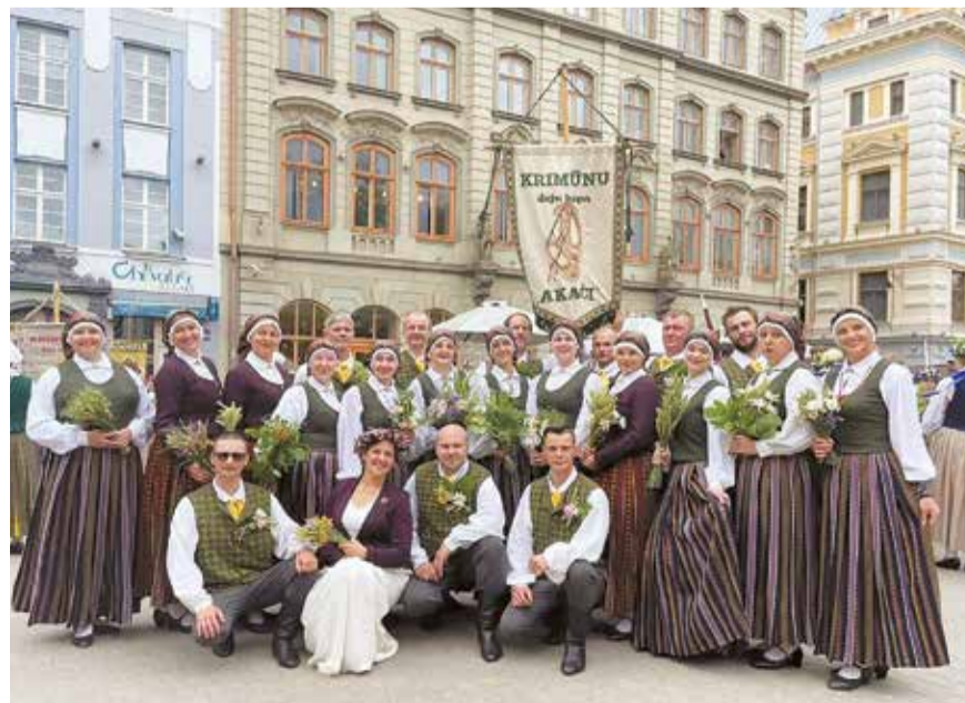
Svētkos Dobeles novadu visvairāk pārstāvēja dejotāji – 340 dalībnieku no 15 kolektīviem.