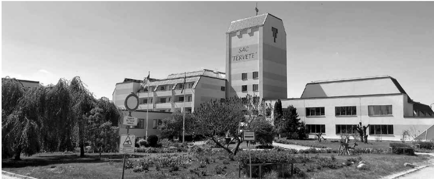
Tērvetes SAC šobrīd.

Būvdarbi norisinājās vienu gadu un tika pabeigti šī gada jūnijā.