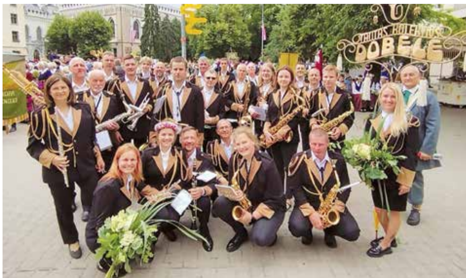
Muzicēšana pūtēju orķestros līdzās kordziedāšanai un tautas dejām ir neatņemama latviešu dziesmusvētku tradīcijas sastāvdaļa. XXVII Vispārējais latviešu dziesmu un XVII deju svētkos Dobeles novadu pārstāv pūtēju orķestris "Dobeles", kas ir viens no senākajiem Latvijā, un pūtēju orķestris "Auce", kura pamatu veido Aucē mūzikas skolas pūšaminstrumentu nodaļas audzēkņi.