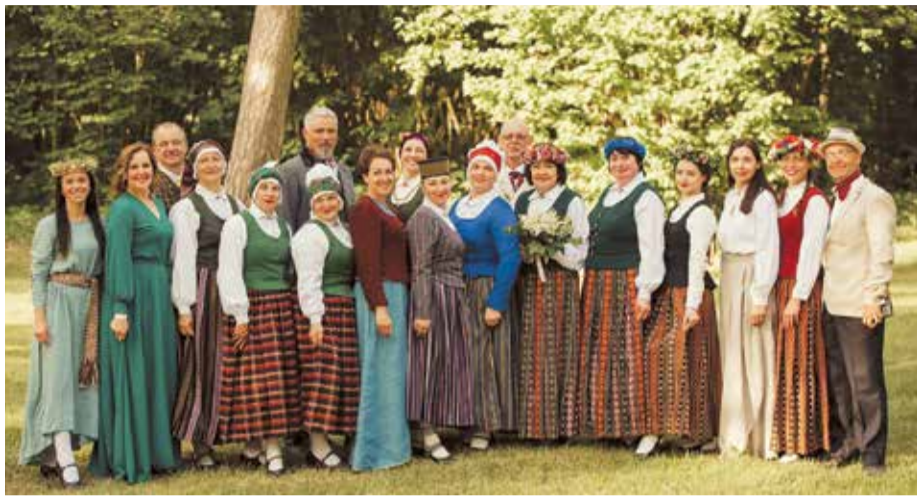
Starp 650 dalībniekiem no 31 kolektīva, kas pārstāvēja Dobeles novadu, bija arī kupls pulks pašvaldības darbinieku. Foto tapis koncertā Ķestermežā 27. maijā, un visi pašvaldības darbinieki, kuri piedalījās svētkos Rīgā, tajā nav redzami.