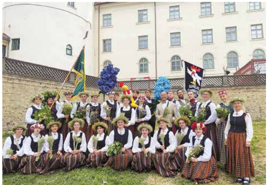
Mūsu novads lepojas ar 7 dziedošiem kolektīviem – 5 koriem, Dobeles pilsētas kultūras nama jaukto kori "Sidrabe", sieviešu kori "Vizma", jaukto kori "Septiņi Sappi", Dobeles Valsts ģimnāzijas absolventu jaukto kori "Sadziedis", jaukto kori "Tērvete" un 2 ansambļiem, Dobeles Valsts ģimnāzijas puīšu ansambli "KPTT" un Dobeles Vācu kultūras biedrības vokālo ansambli "Die Lustigen".

stacionā, un tās abas piedzīvoja rekonstrukciju, lai 2023. gadā uzņemtu Dziesmu un deju svētku dalībniekus un skatītājus.