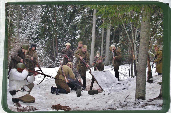
Attēlā: kaujas rekonstrukcija pie Īles nacionālo partizānu bunkura.

Katru gadu 17. martā pie bunkura notiek piemiņas pasākums, kas pulcē daudzus cilvēkus. Pēdējās kaujas norisi rekonstruē biedrība "Latviešu karavīrs".