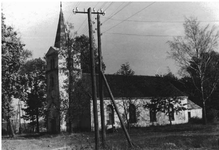
Glūdas baznīca pagājušā gadsimta sešdesmitajos gados.

sājis 2000 RM (vācu okupācijas laikā Latvijā reihsmarkas bija oficiālā naudas vienība no 1941. līdz 1945. gadam).