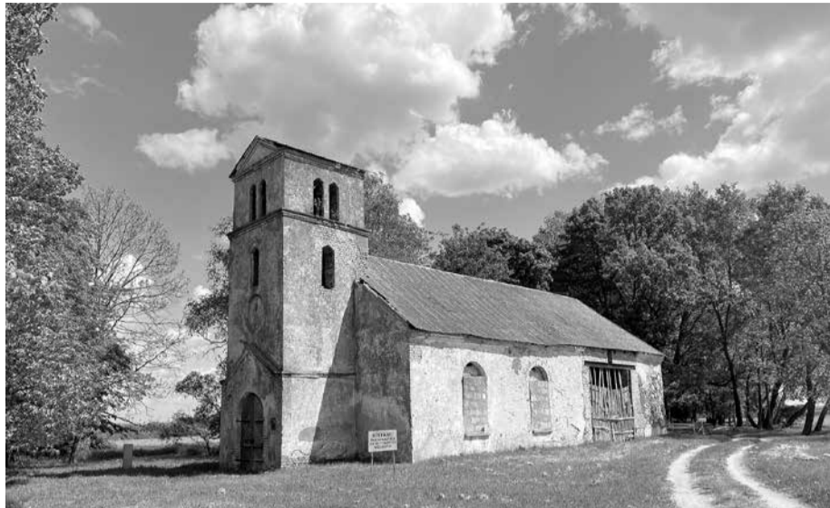
Kādreiz skaistā un cilvēku iecienītā baznīca šobrīd ir avārijas stāvoklī, un baznīcai tuvoties ir aizliegts.

Sekojošajiem pārskatiem, pamanāms, ka ērģelēm paredzētajā sadaļā sākotnēji atzīmēts, ka tādu nav, vēlāk jau parādās ieraksts, ka baznīcā ir “Harmoniūms”, bet pēdējos pārskatos minētas ne tikai pašas ērģeles, bet sniegtas ziņas arī par to remontu vēl vācu okupācijas laikā – 1943. gadā – veiktais remonts izmak-