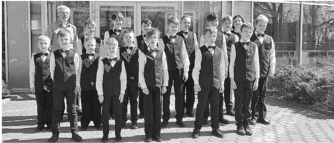
Dobeles Mūzikas skolas zēnu koris.

Dobeles novada pašvaldības Izglītības pārvalde sadarībā ar Dobeles Mūzikas skolu