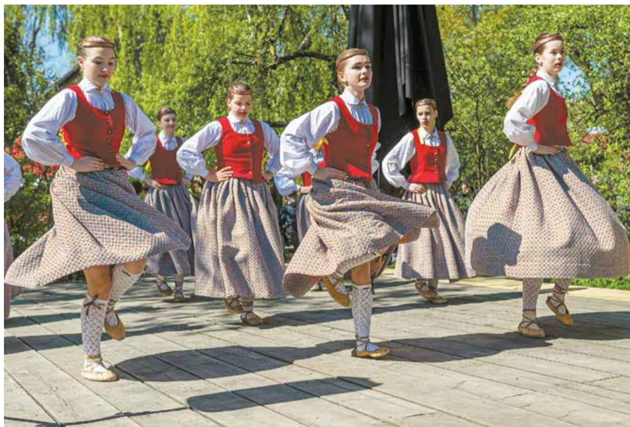
Kalnciema tirdziņā uzstājās arī Vītiņu tautas nama BDK "Virpulis".

Lai prezentētu savu uzņēmēju veikumu un novadā plānotos pasākumus, 6. maijā Rīgā norisinājās pasākums "Dobeles novads Kalnciema kvartālā".