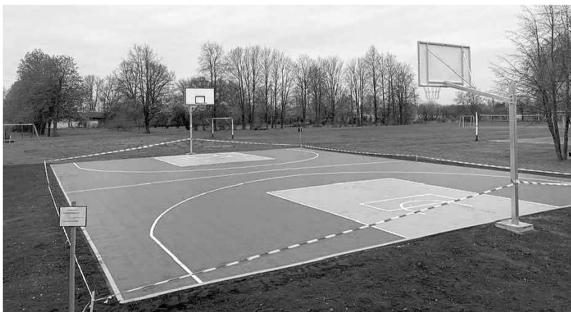
Krimūnu sporta laukums.

Dobeles novada pašvaldības Sabiedrisko attiecību nodaļa