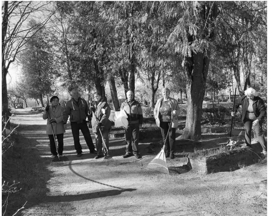
Auces aktīvākie seniori ik gadu Lielajā talkā kopj Sņiķerkalna kapsētas teritoriju Aucē.

Dobeles novada pašvaldības Sabiedrisko attiecību nodaļa