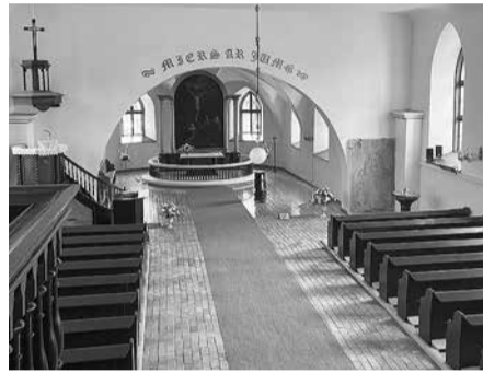
Dobeles ev.lut. baznīcas interjers mūsdienās.