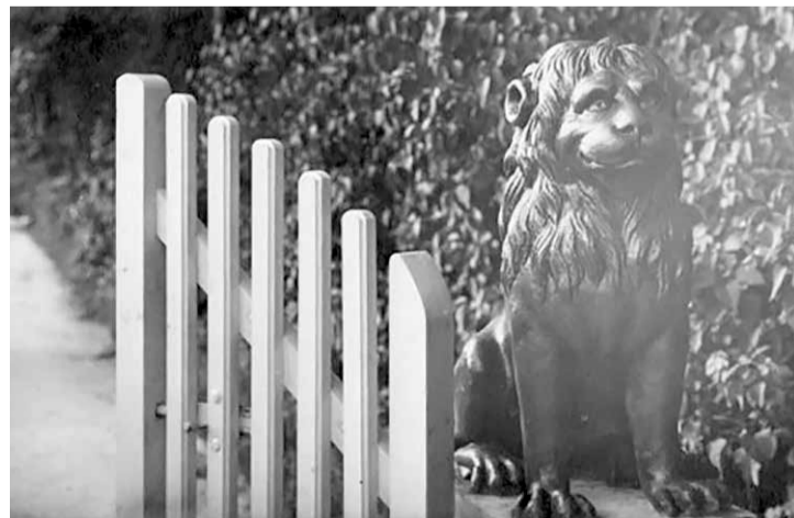
Tērvetes muižas parka iebrauktuves vārtu sargi – lauvas cauri gadu simtiem vēro notiekošo ar ieturētu smaidu.