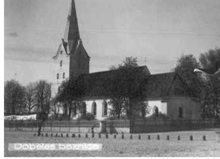
Dobeles baznīca 30. gados.

Mūsdienās senā ēka ir draudzes aprūpēta – jau minētie pagājušā gada remontdarbi spordinājuši altārtelpas daļu, bet draudzes telpā savu spožumu atguvis kroņluku-