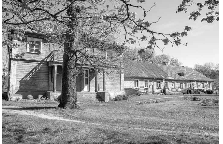
Pālena muiža mūsdienās.

Pateicoties grāfa dzimtai, nu šīs vērtības ir pieejamas ikvienam interesentam arī šodien. Bibliotēkas iespieddarbi attiecināmi uz