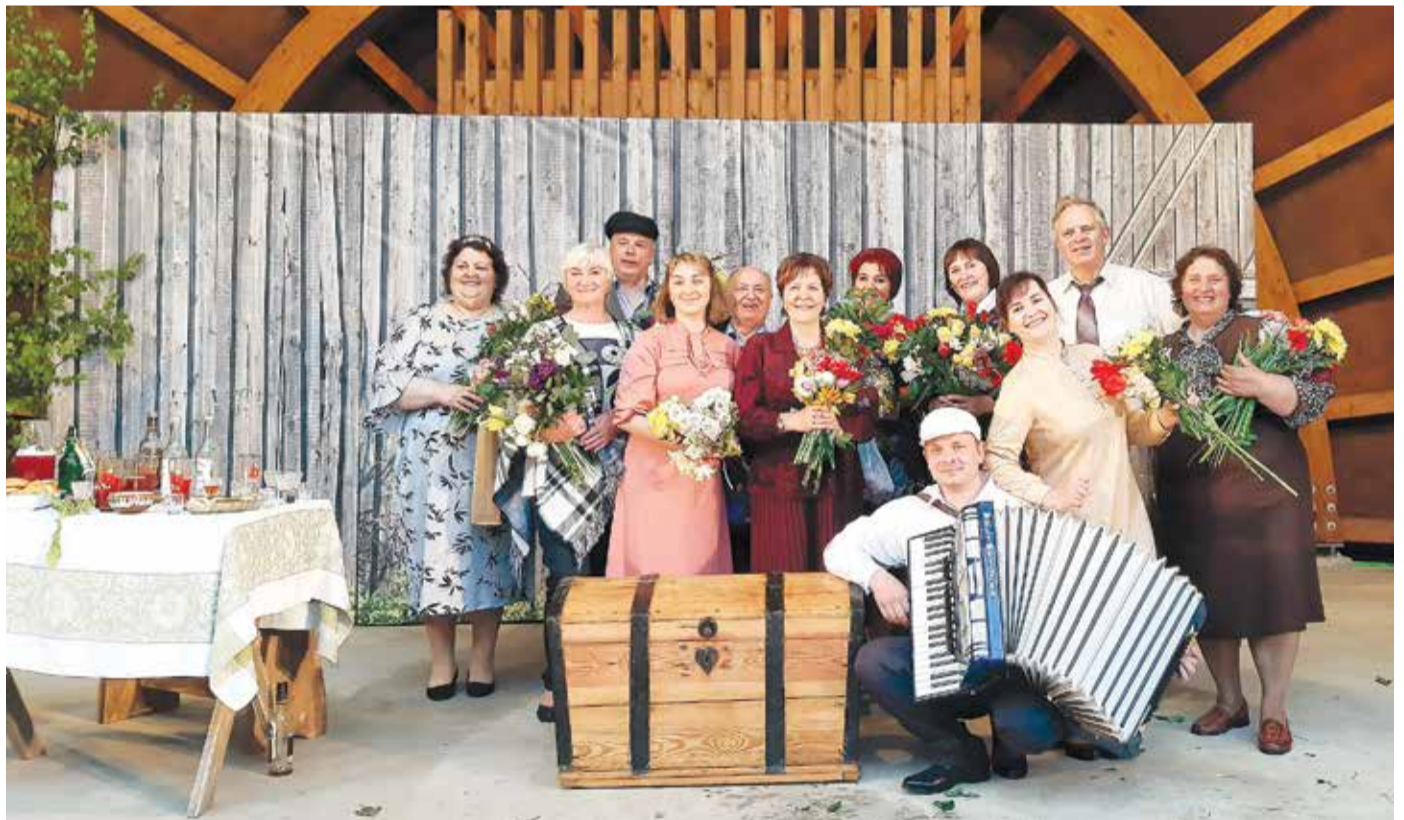
Krimūnu amatierteātris "Skats".

Abas novada kolektīvu režisores izbauda arī iespēju skatīties citu Latvijas amatierteātru, tāpat arī profesionālo teātru izrādes. "Ļoti patīk teātri skatīties. Protams, tā pilnībā atslēgt savu režisora domāšanu jau