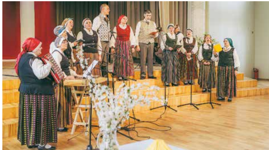
Folkloras kopa “Līgotne” Brīvības svētkos Aucē.