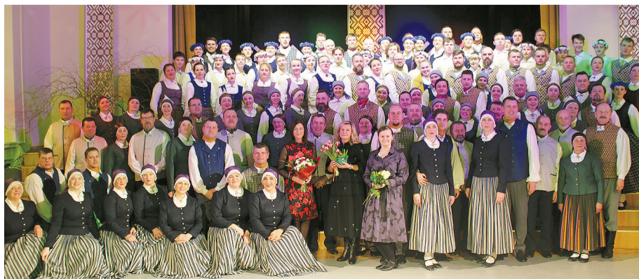
Koncerta "Iepin deju Tērvetē" dalībnieki.

Dobeles novada pašvaldības sabiedrisko attiecību speciāliste