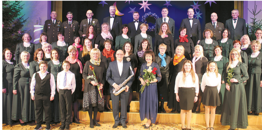
Koris "Tērvete" kopā ar viesiem.

Tērvetes kultūras namā kuplo apmeklētāju skaitu priecēja krāšņā dziesmu un muzikālo izpildījumu buķete. Tas bija negaidīts pārsteigums komponistam, pašiem dziesmu izpildītājiem un viennozīmīgi klausītājiem! Iespējams, ka Tērvetē vēl kādu reizi