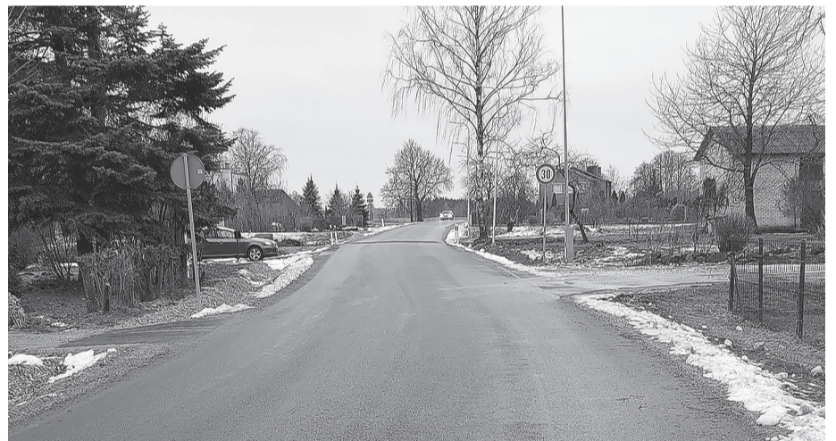
Skolas iela Auros pēc pārbūves.