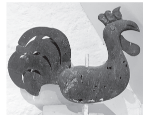
Annenieku baznīcas torņa smaili rotā gailis.

ras lielas krāsni. Starp solu rindām bija brūgēts ķieģeļu segums, bet malās zem soliem – dēļu grīdas, tās izlauza. To visu izdarīja paši vietējie, ir pat zināms, kuri trīs tie bija. Kā skolniece arī šeit ienācu, augšā bija vēl ērģeles, kas jau bija pajauktas. Daži ērģeļu fragmenti vēl ir saglabājušies līdz šodienai, noglabāti kapličā. Diemžēl altārglezņas liktenis nav zināms."